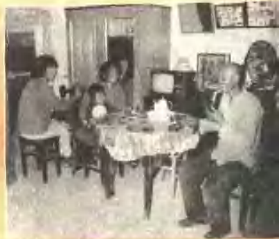
门头沟涧沟大队社员靠劳动致富，生活越过越红火。