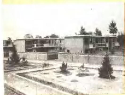
昌平县彩河大队新建的农民楼。