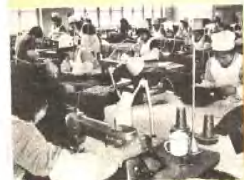
房山县豆店大队和市服装三厂办起了联营的服装厂，图为缝纫车间的工人正在生产出口服装。