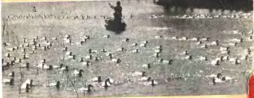
顺义县前鲁各庄大队，发展北京鸭的养殖，将为首都市场提供大量的填鸭。