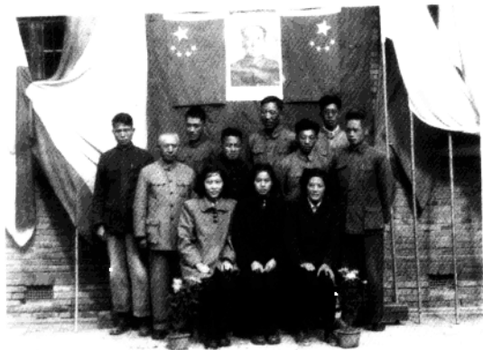
▲1953年9月,建国后第一次普选时的 三牌楼选区投票站。