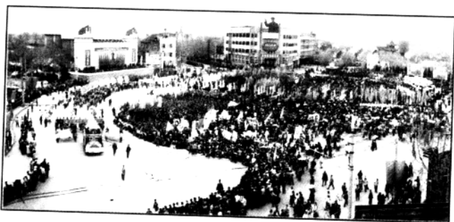
▲1969年4月1日，“九大”召开，鼓楼广场举行了百万人的集会、游行。