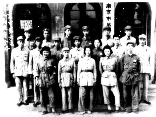
▼ 1949年8月,南京市第六区人民政府 全体工作人员合影。