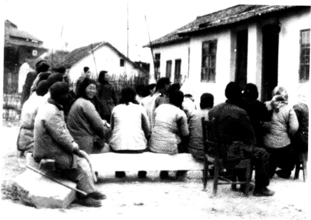
▼ 1955年,福建路居民收听有关宣传 新中国第一部《兵役法》的广播。