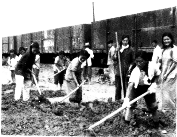
▲ 50年代,鼓楼区干部群众参加铁路建设。