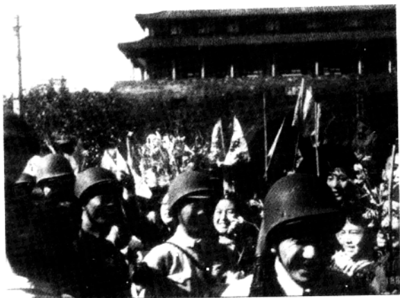
▲解放军主力由挹江门进城,受到鼓楼人民热烈欢迎。