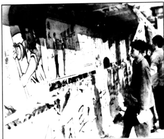
▲“文革”中，南京大学大字报栏的一角。