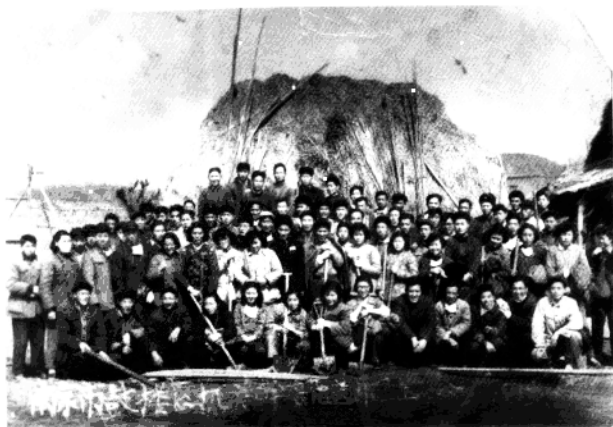
▼1954年,区机关干部支援农业生产送肥下乡。