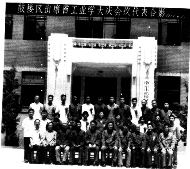
▼1977年，鼓楼区出席省工业学大庆会议代表。