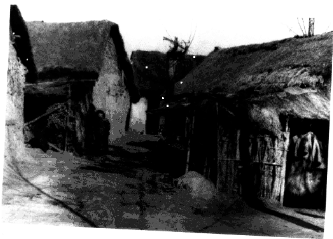
▼ 50年代初的中山北路乐业村。