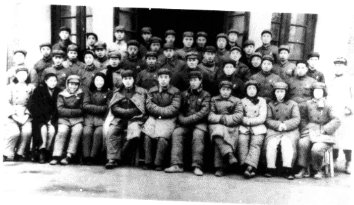
▲ 1950年,南京市第五区全体工作人员合影。