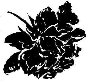
點去反 面下垂 月季花 式