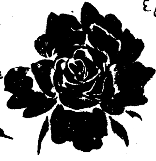
點去正面 月季花 式