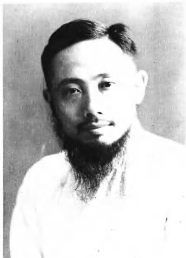
读书出版社创办人李公朴先生 (一九〇〇——一九四六)