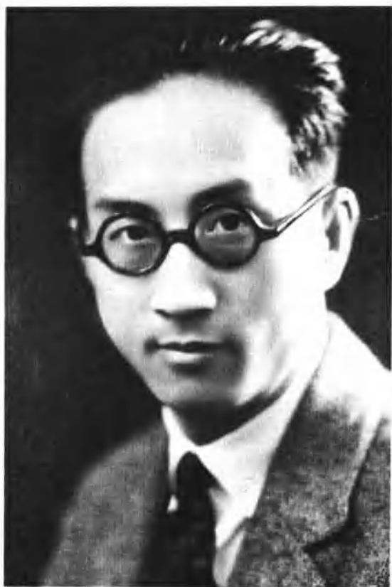
生活书店创办人邹韬奋先生 (一八九五——一九四四)