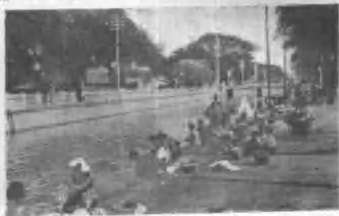
景 風 的 岸 沿 河 運