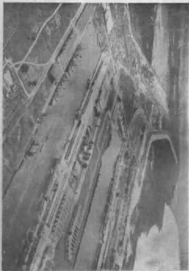
圖 丹 不 樂 海 口 圖