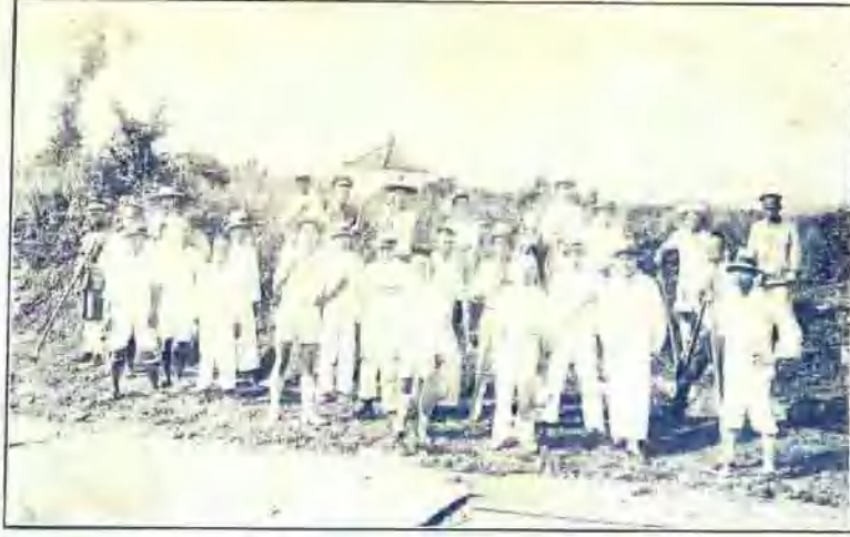
↑ 縣黨政人員築路情形