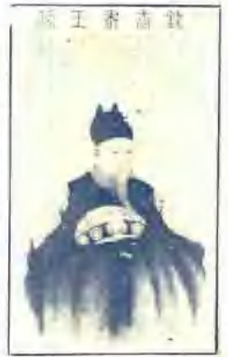
像 道 王 肅 武