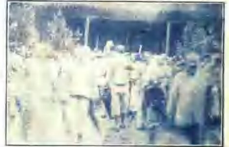
↓ 經縣長為善勸慰後請願民眾離開縣府