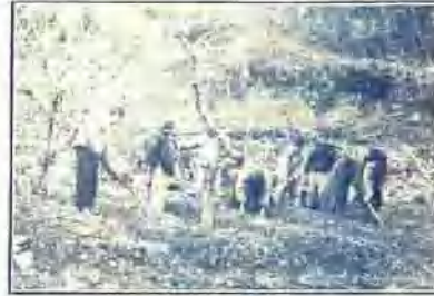
↑ 聖關縣政後山之苗圃工作情形