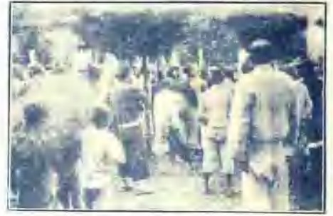
↑ 杭州烟商來推紙情民憤向府願情 ↓ 縣商州煙銷情激憤向府願情