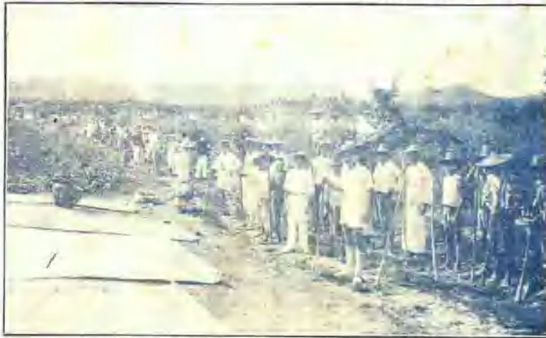
↑ 錦城鎮第八保壯丁修築路西路