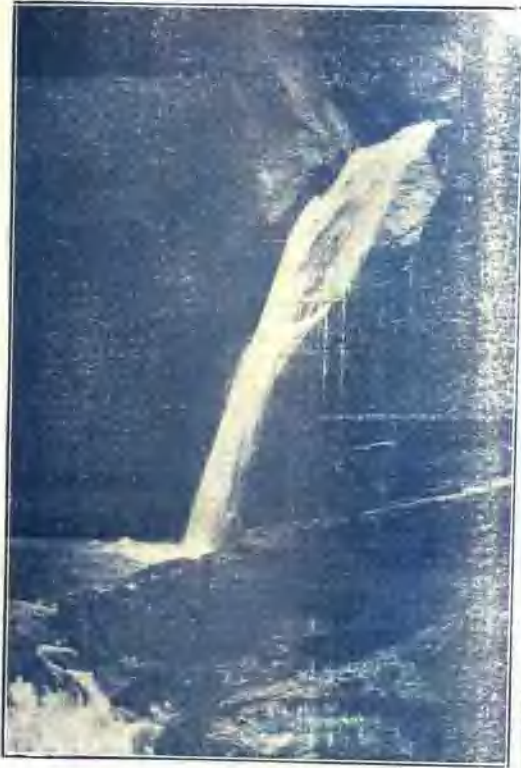
↑ 布 瀑 潭 龍 山 瓏 玲