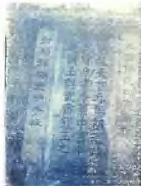
↑ 碑 墓 王 錢 之 麓 山 廟 太