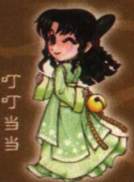
叮 叮 当 当