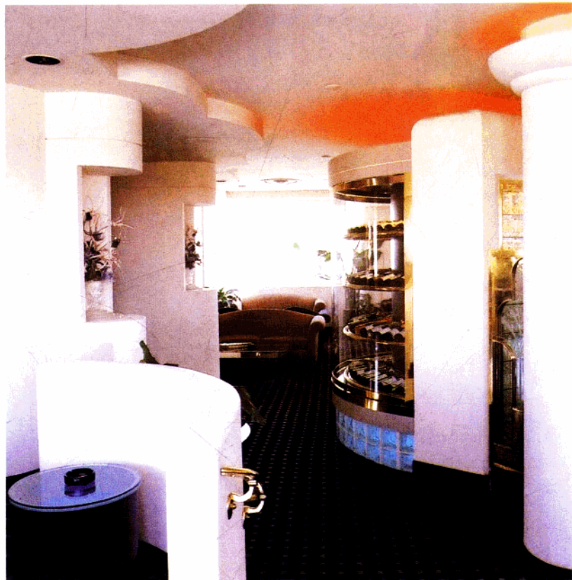
隔间过道全部采用弧线体造型,如同音乐的旋律。 酒吧的地面使用的是深色大理石,恰到好处。