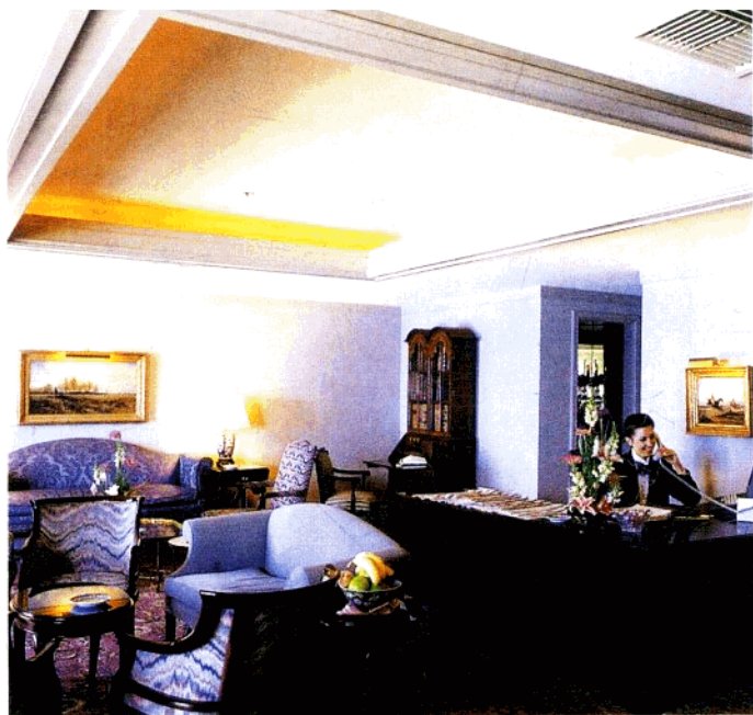
合理的经理室设计