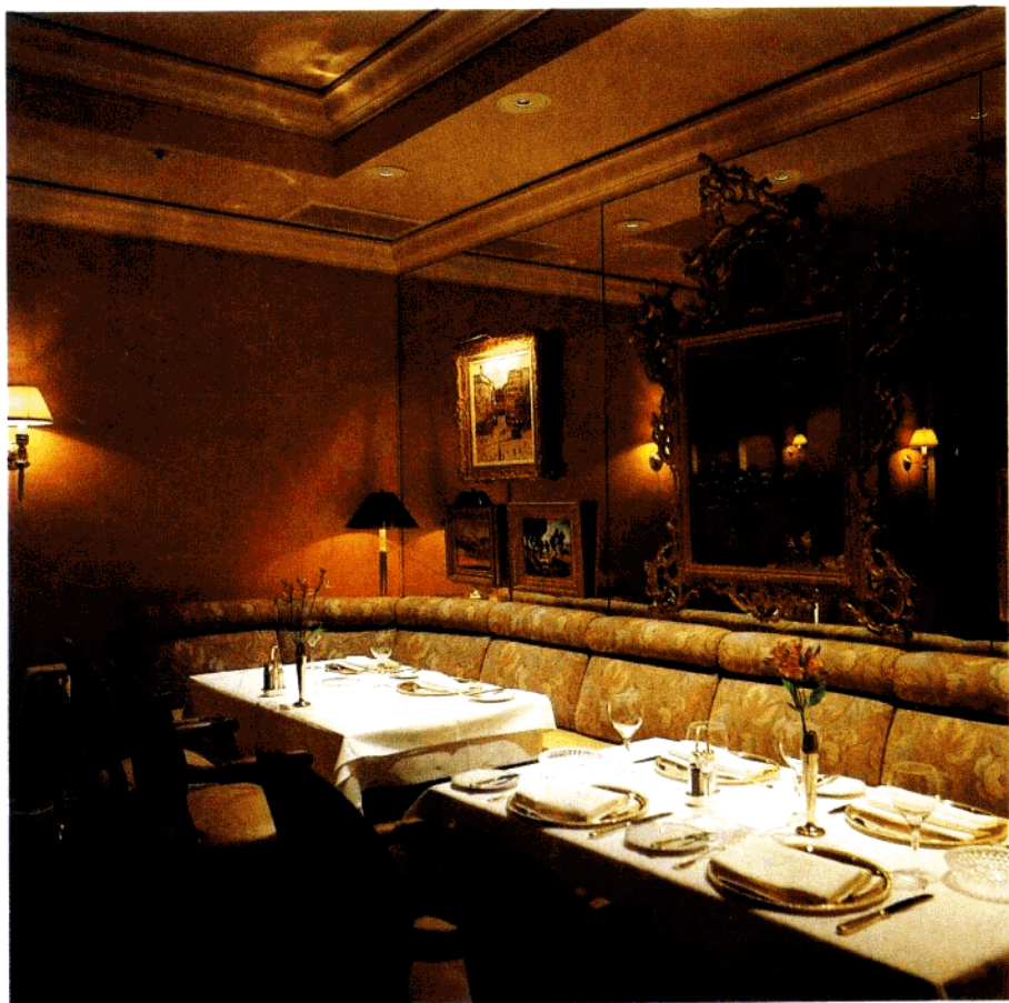
壁上的装饰增加了宫廷的气氛