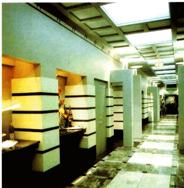
通道采用石壁，增加了厚重感。