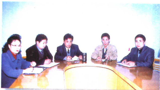
医院领导班子成员