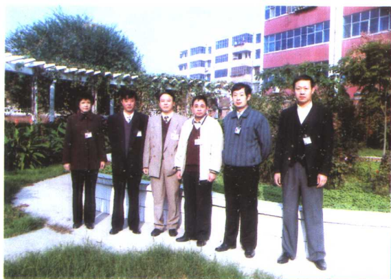
▶ 医院 领导班子 成员