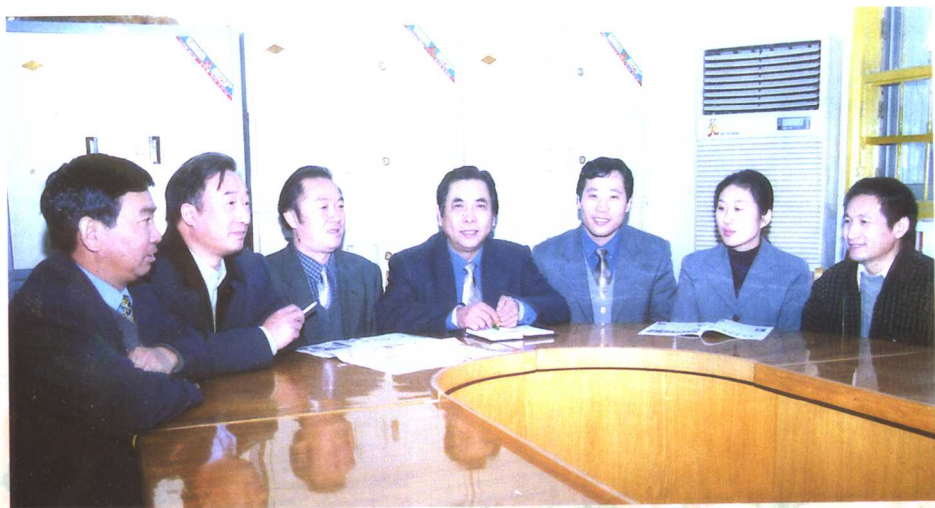
▲ 卫生局领导班子成员