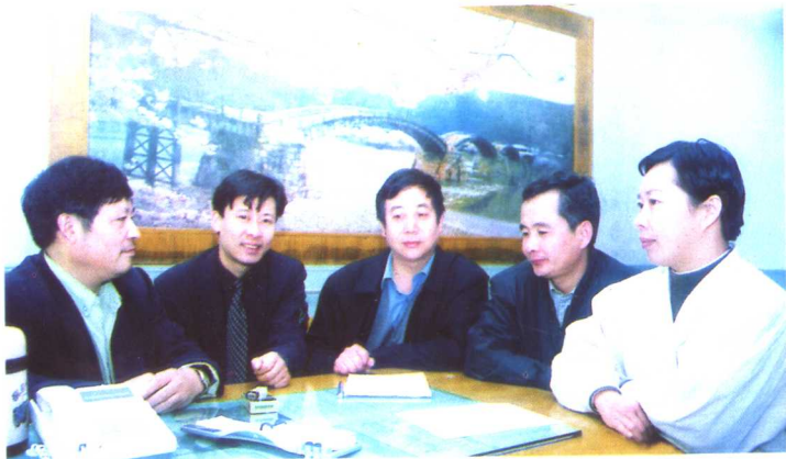
医院领导班子成员