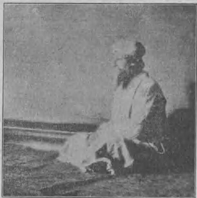
爾 戈 太 的 化 同 然 自 與