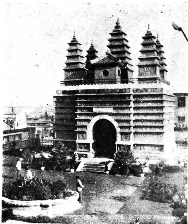
五塔寺，原名慈灯寺。建于清雍正五年（1727年）塔总高16.53米。塔口上有蒙、汉、藏三种文字的“金刚座舍利宝塔”。