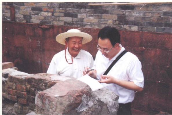
市镇普查员到江边村调查。