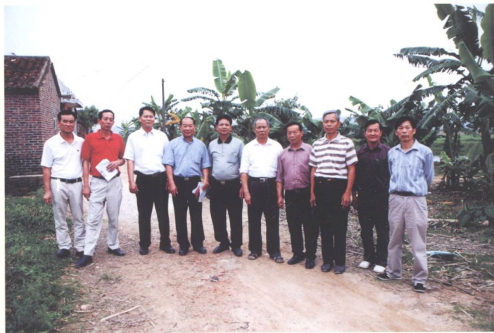
➤ 镇普查办人员到博夏村工作后，与当地联络员合影。