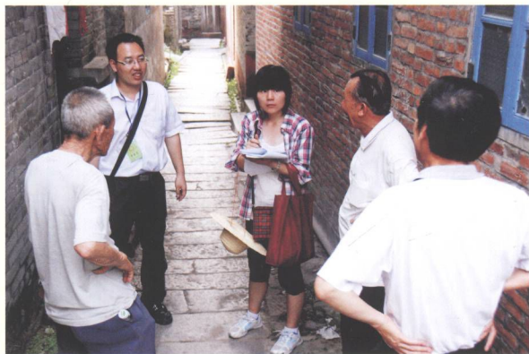
普查员在核实材料。

普查队采取“白天调查，夜间整理”的工作方式，及时对调查、访谈所作的记录和拍摄的文物照片进行系统整理，登录《第三次全国文物普查不可移动文物登记表》。