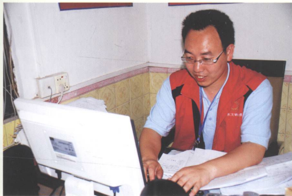
普查员在晚间工作。