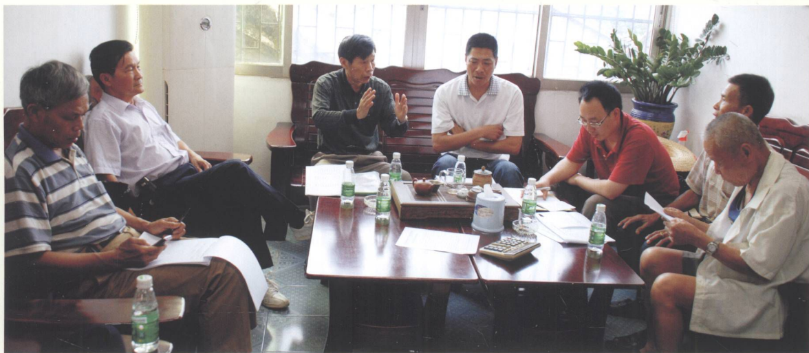
图 为根据实际调整勘查路线。