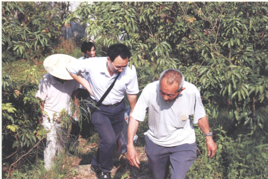
市镇普查员在当地热心长者的带领下前往文物点。

以村（居）联络员为导向，镇普查员配合市普查队对我镇辖区内的所有文物点进行实地调查，进行GPS测点、测量、拍摄、描述文物本体 记录文物保存情况及环境状况等。