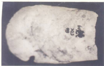
图8 图为20世纪六十年代出土的遗物。