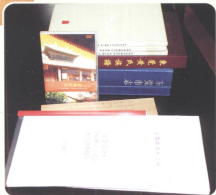
➤ 镇普查办搜集到的相关文献资料。