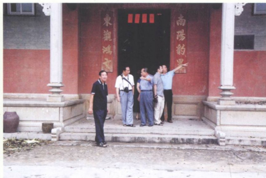
文史专家叶春生教授到我镇视察文物保护工作。