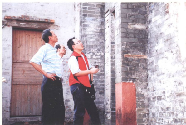
普查员对文物点进行勘测。