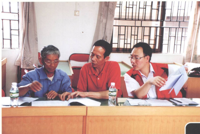
➤ 图为指导普查员填写《第三次全国文物普查不可移动文物线索登记表》