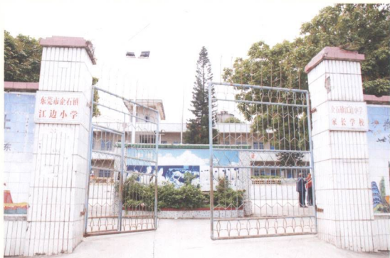
图9 图为遗址近况及2001年出土的遗物