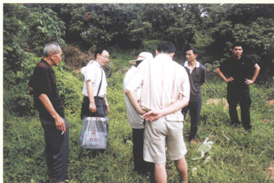
市、镇、村三级普查人员 到各文物点进行实地勘查。