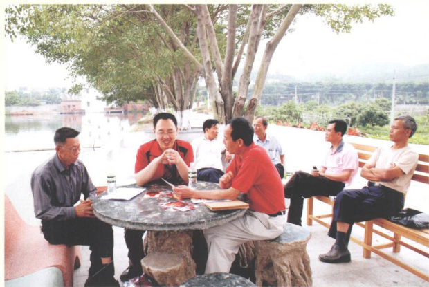
普查人员在收集文物点的有关史料。