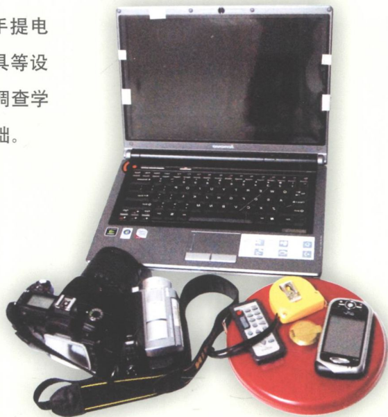
➤ 我镇购买的普查设备

为了开展文物普查，我镇专门购买了数码相机、手提电脑、GPS全球卫星定位仪、红外测距仪、皮尺和绘图工具等设备，同时还派人到省、市参加培训，到桥头镇进行现场调查学习，熟悉普查标准和 workflows，为本镇普查工作奠定基础。