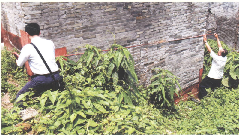
普查员在丈量实体。