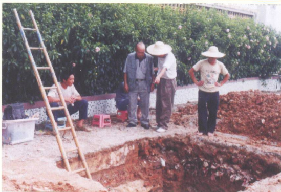
图7 图为万福庵遗址2001年发掘现场之一

万福庵遗址是东莞目前发现最早有先民生活过的地方，也是珠江三角洲地区所见年代较早的贝丘遗址之一，对研究古代社会的演进，岭南文明起源、文化交流以及民俗文化中具有重要意义。