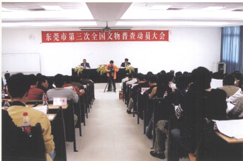
➤ 参加市举办的学习普查培训