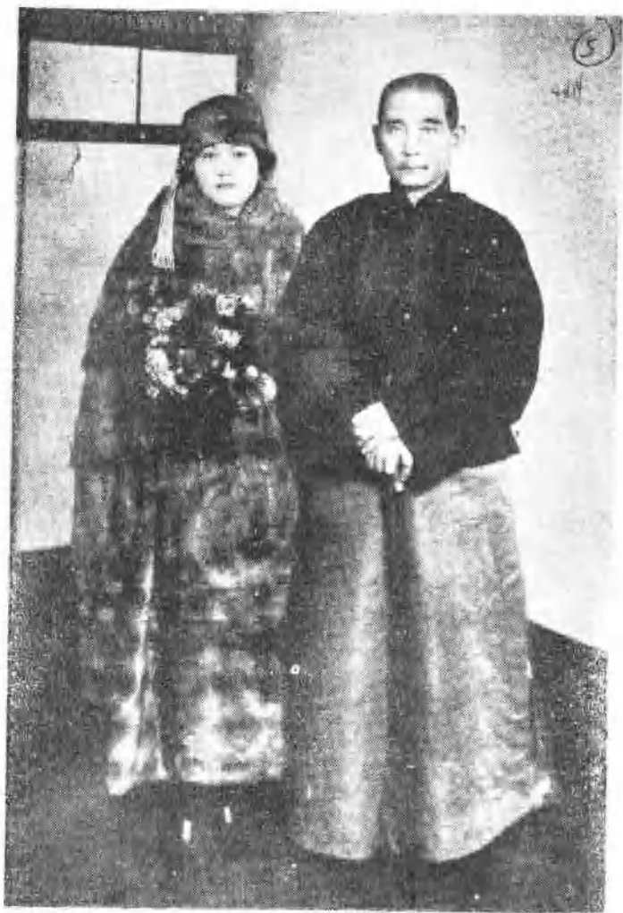
孙中山先生与宋庆龄女士合影