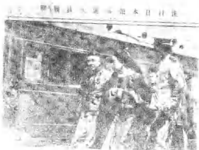
清朝官吏仓皇逃走