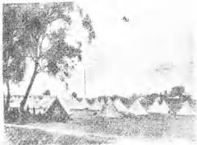
武昌革命军在城郊的营地