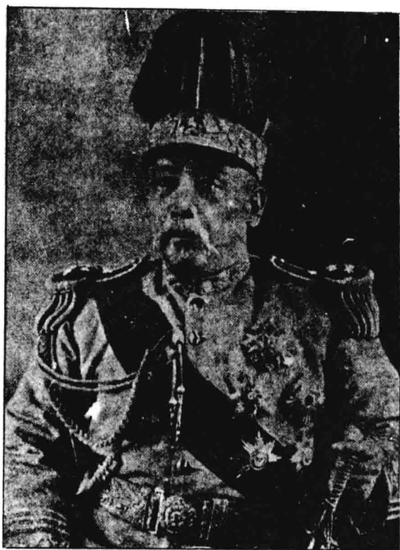
中華民國總統袁世凱，和揭發袁世凱禍國的史料。