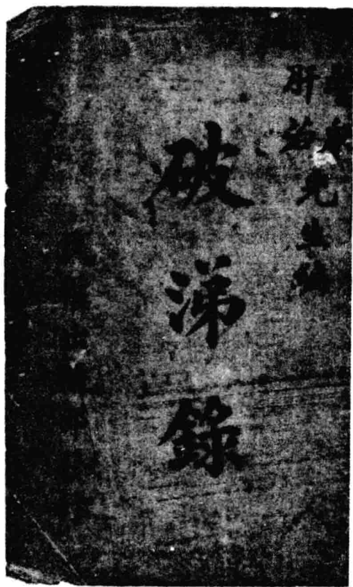
七十年前言論自由的文證！