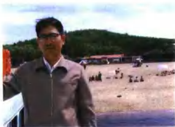
工作以后第一次外出