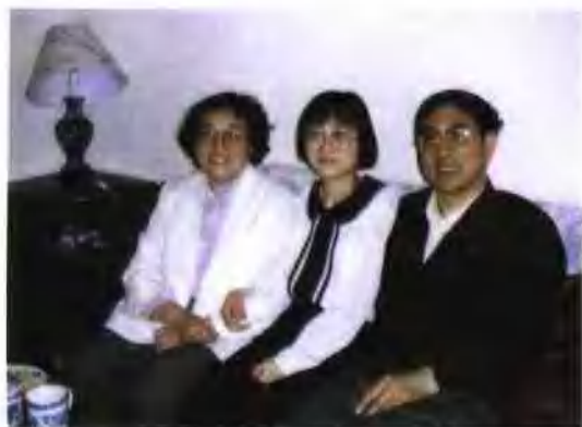
一家三口，其乐融融