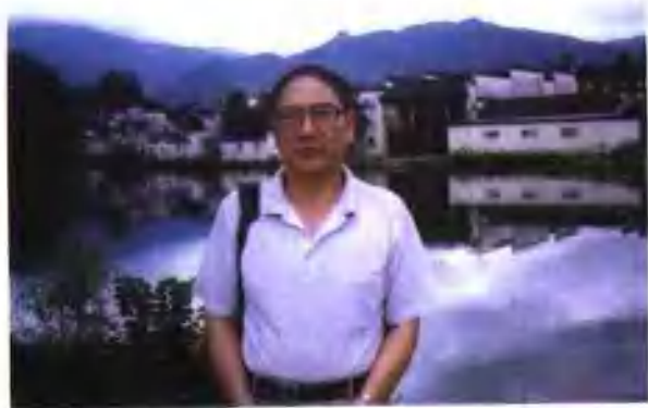
享受黄山古寨的风光