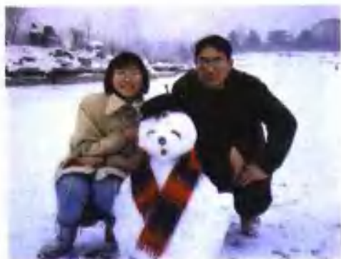
和女儿一起堆的雪人儿 多漂亮