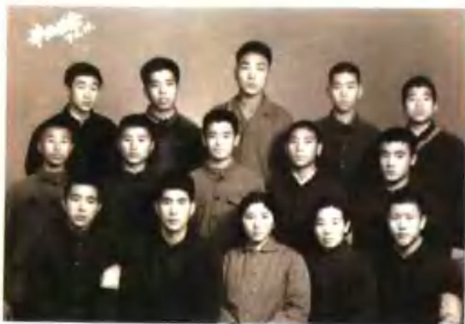
虽然年轻，可是已教了这么多学生