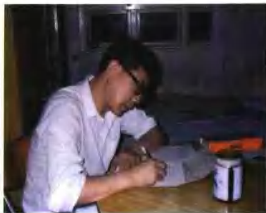
创作的欢乐和艰辛