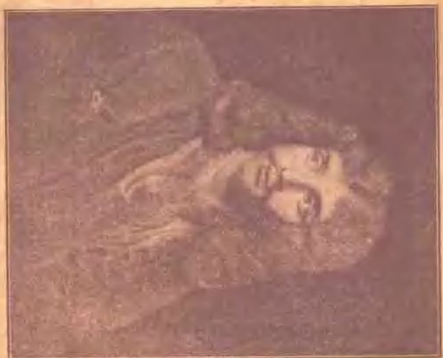
Johann Sebastian Bach (作曲家)