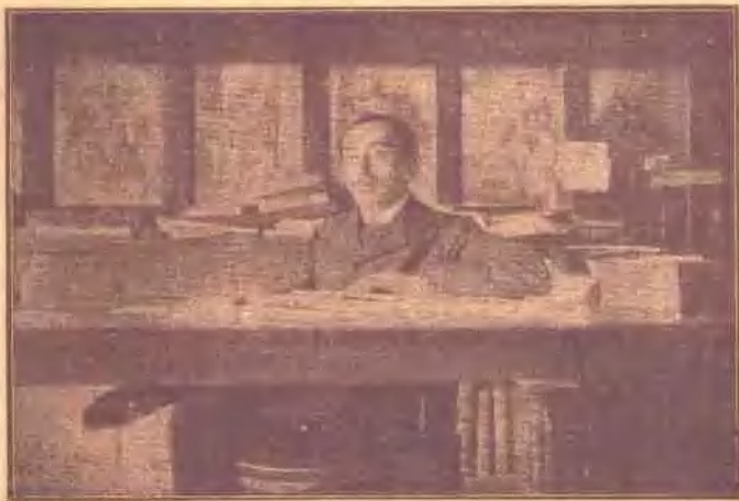
Maurice Barrès (小 說 家)