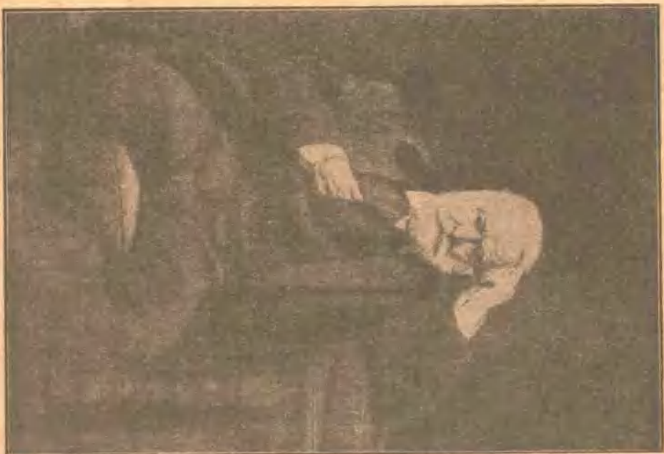
Victor Hugo (小説家)