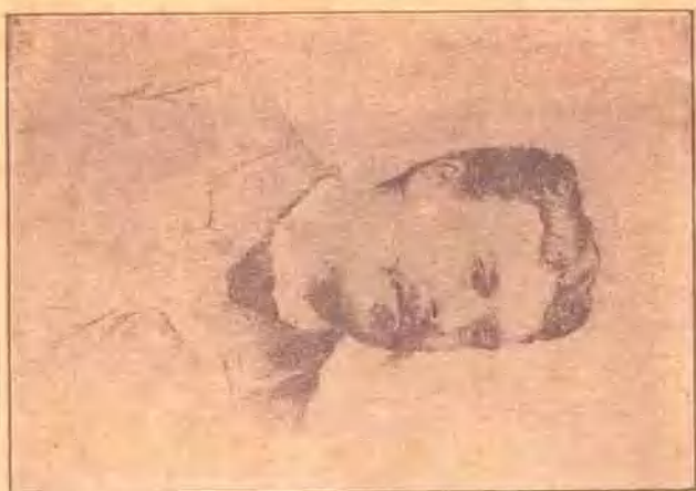
Guy de Maupassant (小說家)