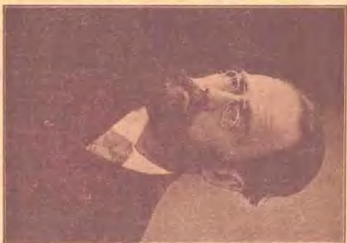
Emile Zola (小說家)