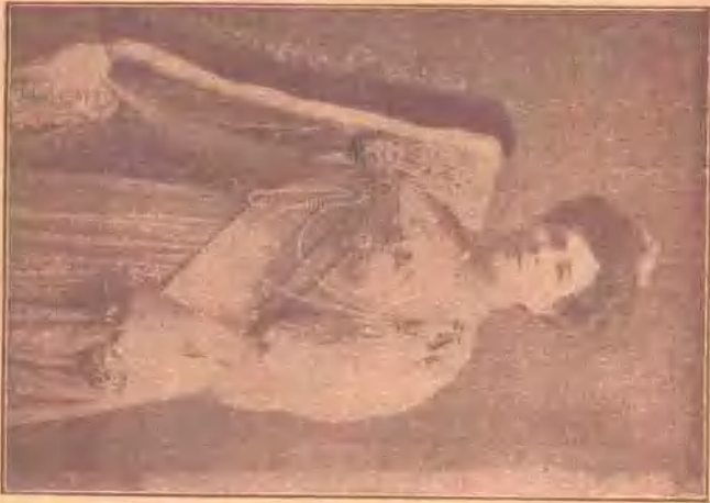
Mme. Jeanne Granier (演 劇 家)