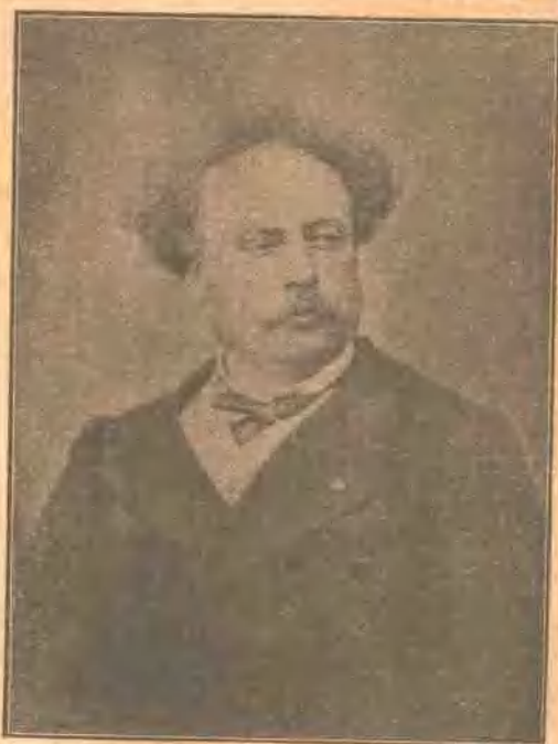
Alexandre Dumas, Fils.