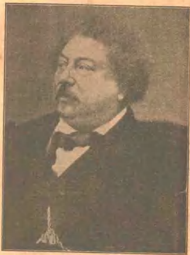
Alexandre Dumas, Père.