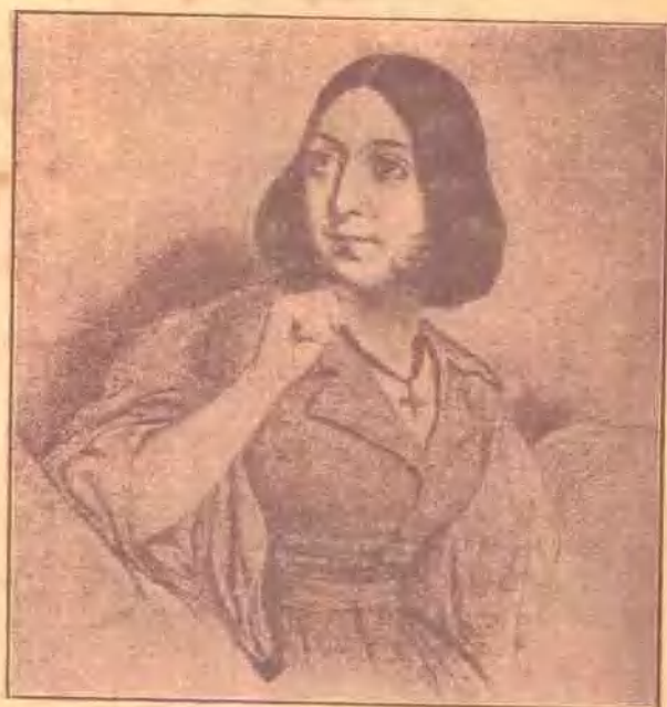
George Sand (小說家)