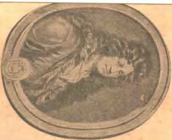
Jean Racine (戲曲家)