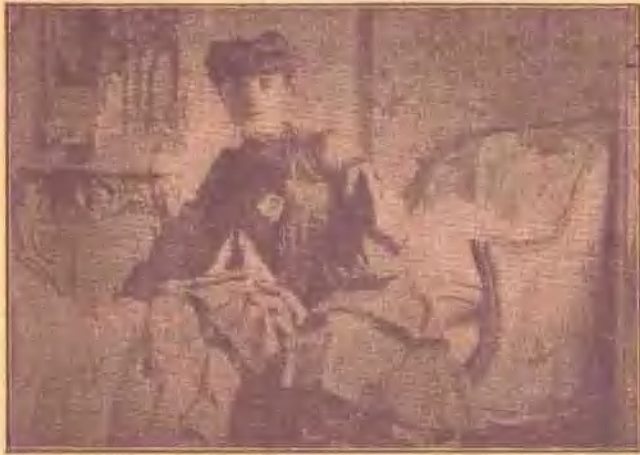
Countess de Noailles (小 說 家)