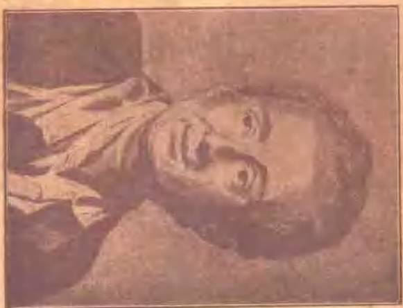
Ludwig van Beethoven (作曲家)