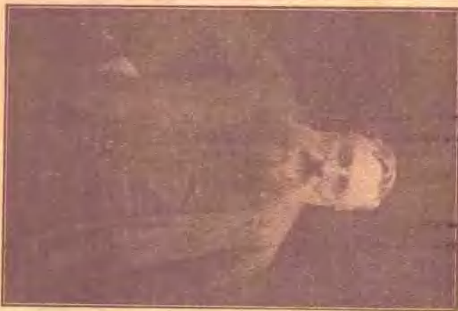
M. Auguste Rodin (雕 刻 家)