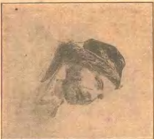
Théophile Gautier (詩人)