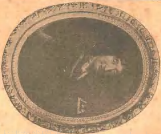
J. de la Fontaine (寓言家)