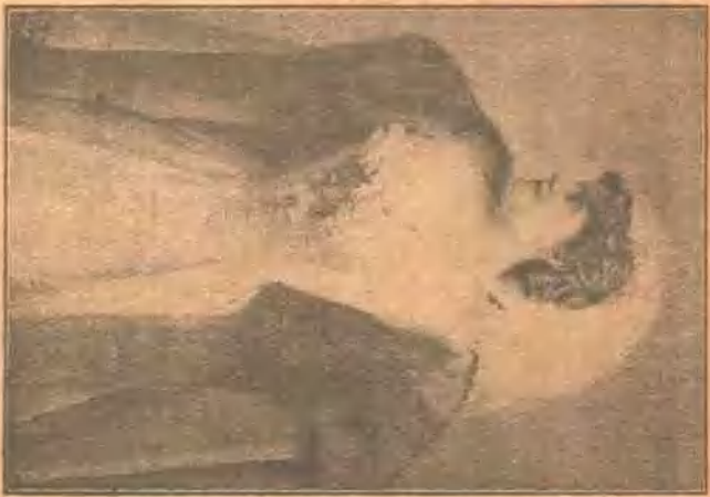
Mme. Réjane (演 劇 家)