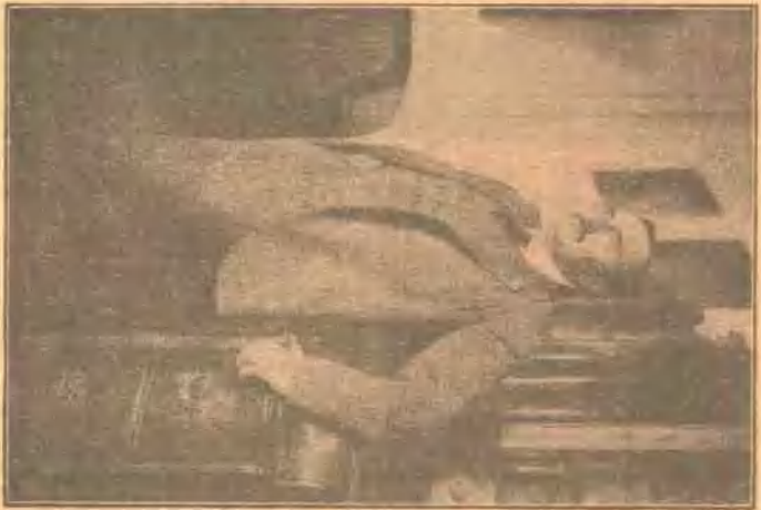
Paul Claudel (小說家)