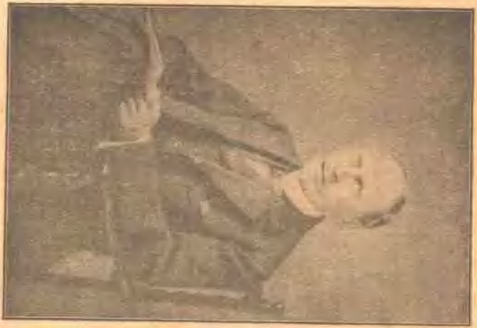
Romain Rolland (小說家)