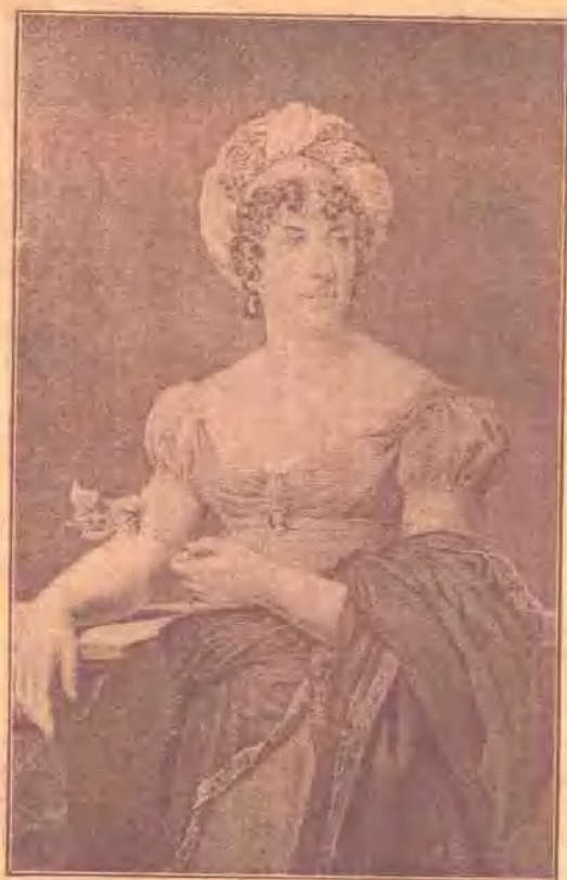
Madame de Staël