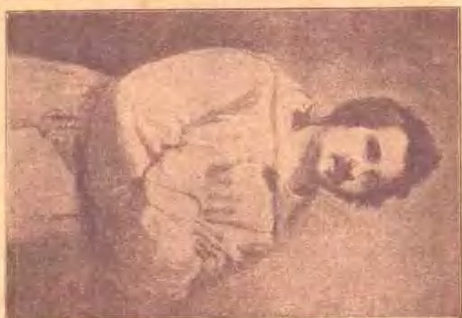
Honoré de Balzac (小說家)