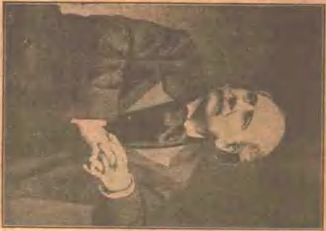
M. Jules Massenet (普 樂 家)