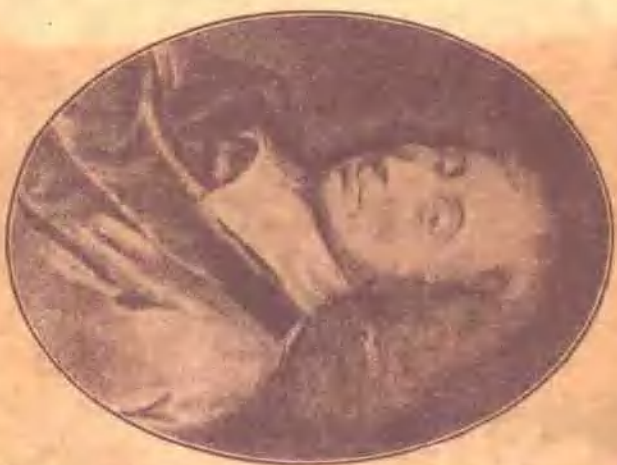
Giuseppe Puccini (作曲家)