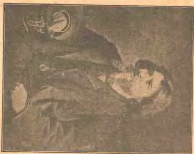
Alphonse Daudet (詩人, 小說家)