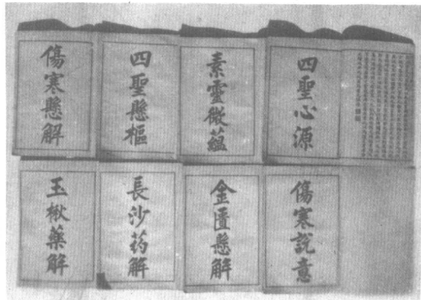
黃氏醫書八種石印本扉頁