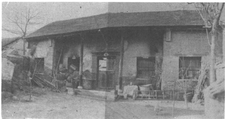
一九八〇年初发现时的黄元御故居