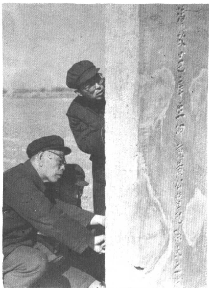
调研小组在考察黄氏碑文残字