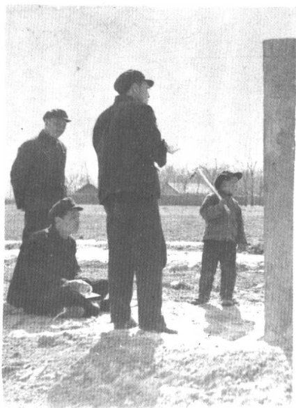
调研小组在记录黄氏碑文