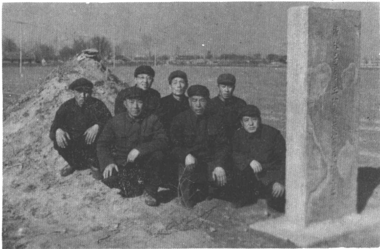
黄元御调查研究小组 (后排左二为作者)