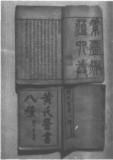
黃氏醫書八種 上為道光年間木刻本 下為光緒年間石印本