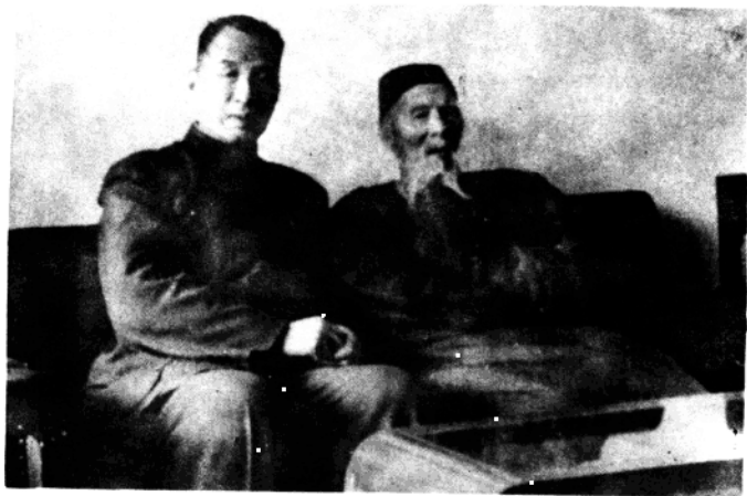
1956年呼孟斋在北京与齐白石合影。