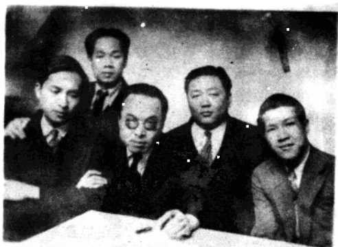
李杰民于1933年在法国巴黎西撒佛朗克音乐学院留学期间与冼星海等同学合影。右一为冼星海，右二为李杰民。