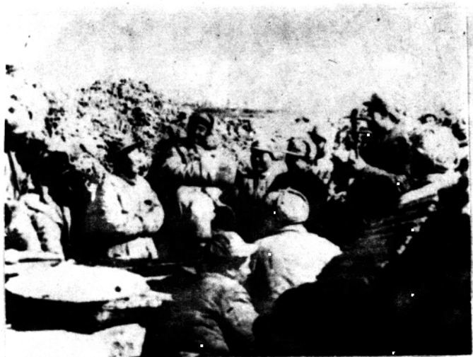
1948年12月,马旋深入淮海战役最前沿为战士们演唱。左二为马旋。