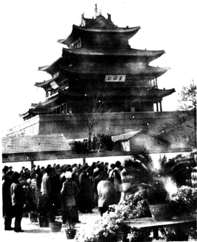
聊城光岳楼,建于明洪武7年(1374年),现为全国重点文物保护单位。