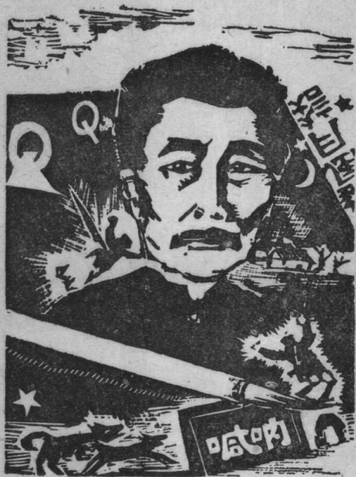
木刻像與先生題句

曹白刺。一九三五年夏，全國木刻展覽會在上海開會， 此是田市畫報宗亞。老爺，我孩着了供木刺化。這不 行，一刺王了。