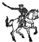
圖 書 館 學 要 旨