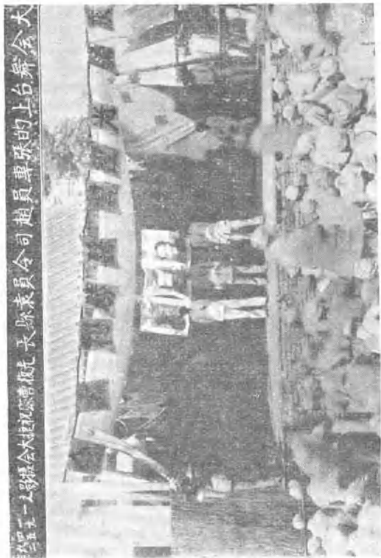
大舞台的專員趙司員張的台上舞會大