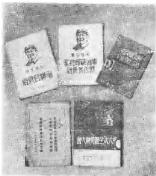
华东新华书店出版的图书