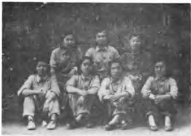
一九四九年山东新华书店印刷厂装订股部分女同志合影