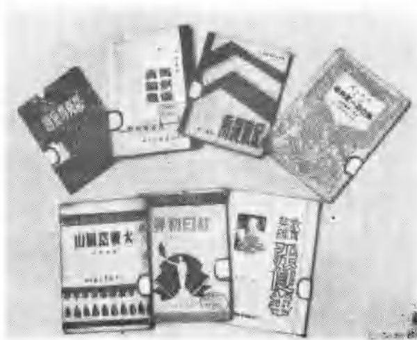
山东新华书店出版的图书