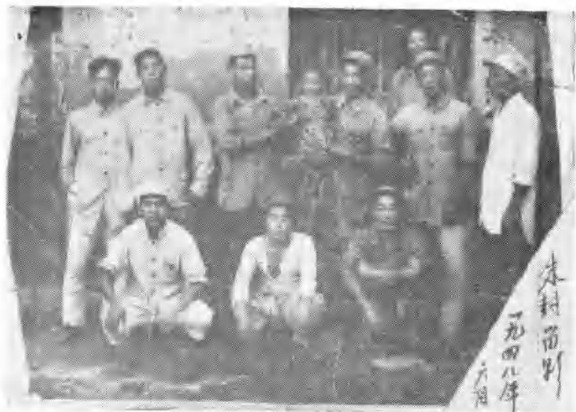
一九四八年六月大众日报社印刷一厂铜版股、打版 铸字股部分同志合影