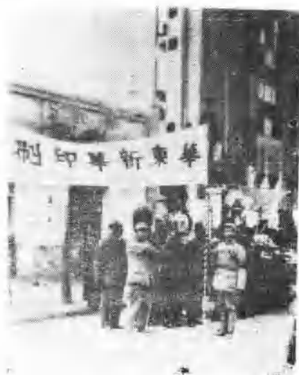
一九四九年初华东新 华印刷厂职工参加庆祝淮 海战役胜利游行前摄影