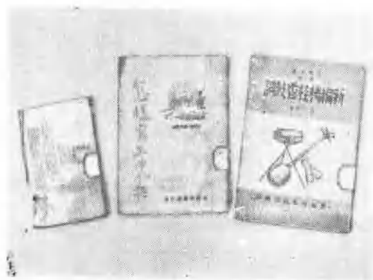
渤海、渤海新华书店出版的图书