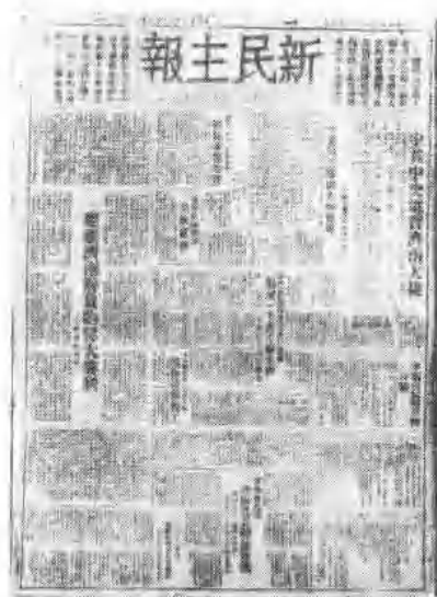
一九四八年十月二日 出版的《新民主主义报》第二 期。