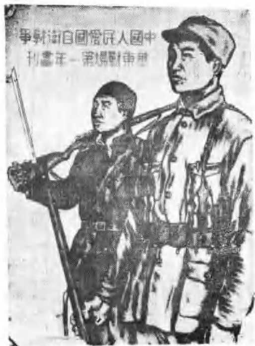
一九四七年出版的《中國人民愛國戰爭華東戰場第一集畫刊》封面