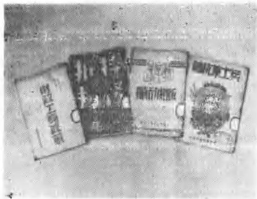
胶东新华书店出版的图书