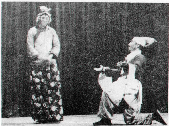
▼ 缝特勒 1956年演出