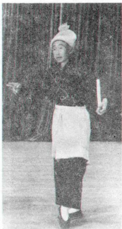
一九五三年徐生演出剧照