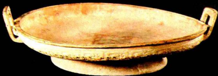
春秋“曹公”銅盤（一級文物）