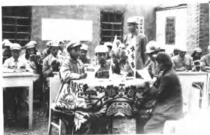
宣传队深入田间， 工地慰问演出，深受战 士的欢迎