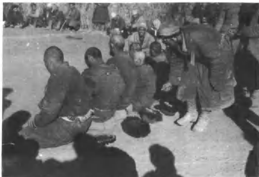
1951年土改建设中疏勒县农民用豆子投票选举自己的干部