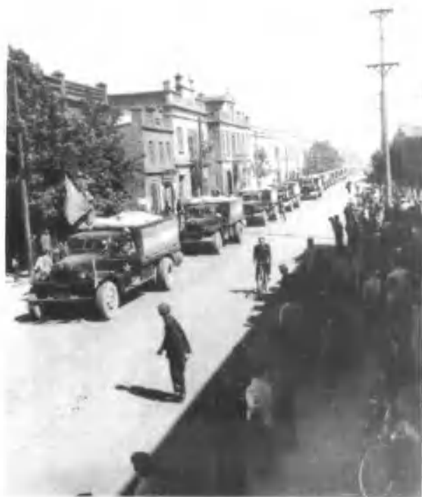
1953年7月，驻疆某部队喜获丰收，50多辆汽车将第一批小麦55万斤运抵乌鲁木齐