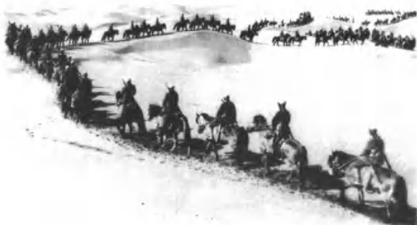
1950年3月,我剿匪部队六军十七师四十九团行进在沙漠中