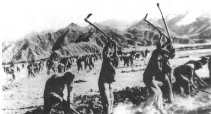
1950年,大部队作业开荒种田 (新疆区党史委供稿)