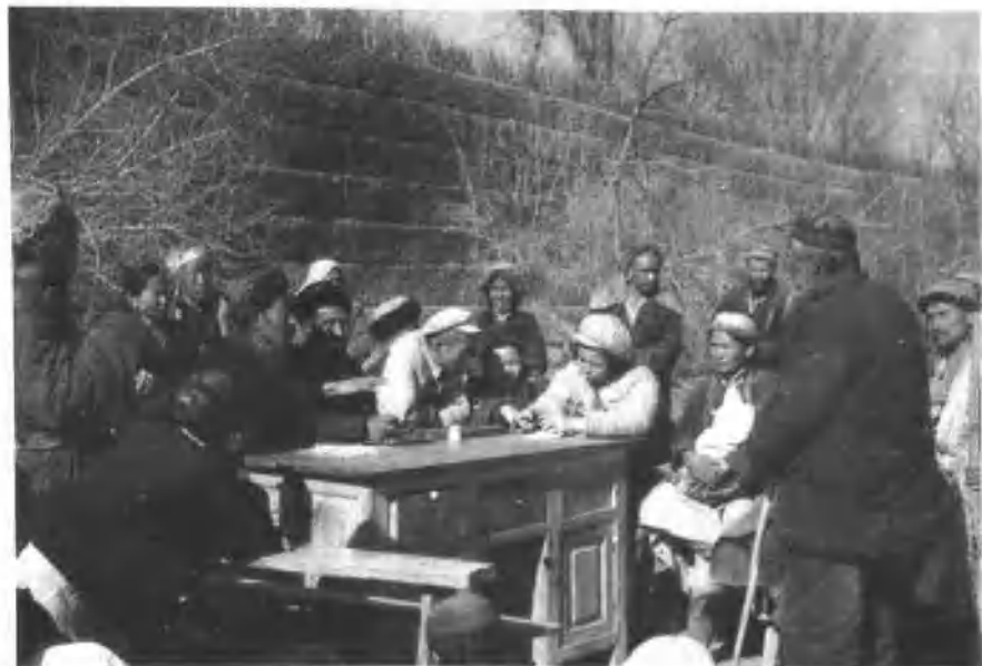
1950年冬,二军直属队帮助疏勒县农民进行减租反霸