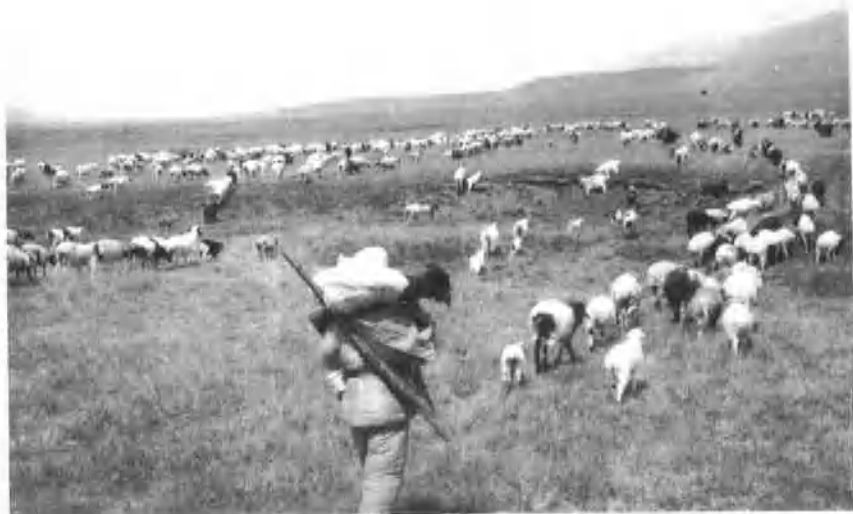
战士在天山牧场背枪放牧