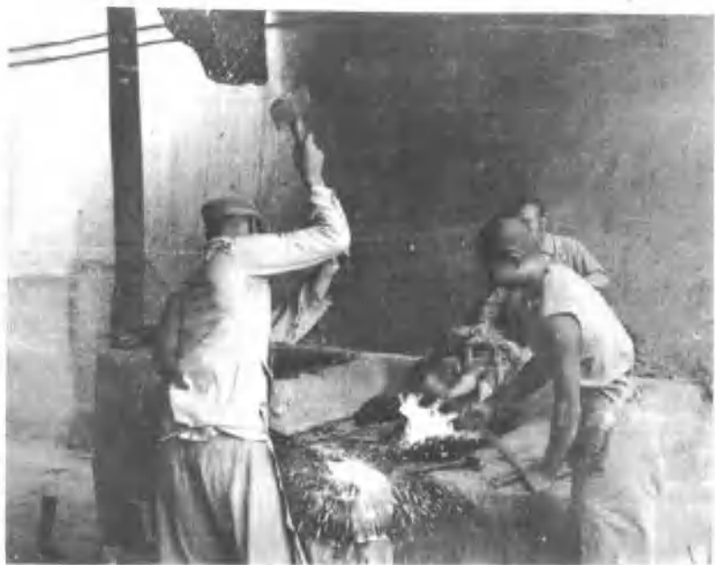
1951年，二军十八团战士自制粪筐