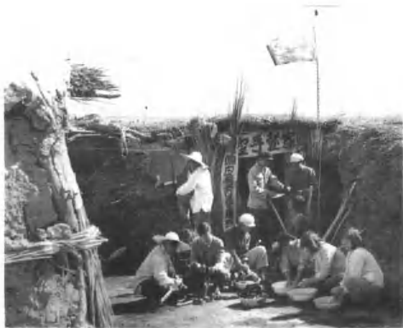
艰苦创业，盖起“地窝子”，白手起家。