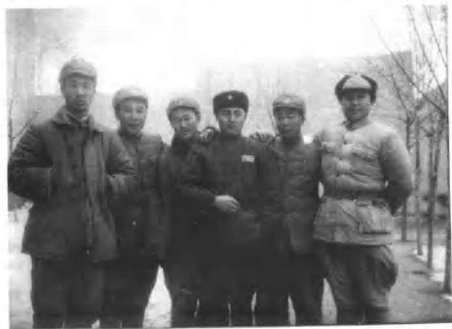
解放军、民族军和起义部队亲密合作共同建设保卫新疆。图中左起：二军政委王恩茂、副军长顿星云、副政委左齐、十三师师长伊敏诺夫、二军军长郭鹏、起义将领原国民党新疆警备副司令员兼四十三师师长赵锡光(1949年冬)。