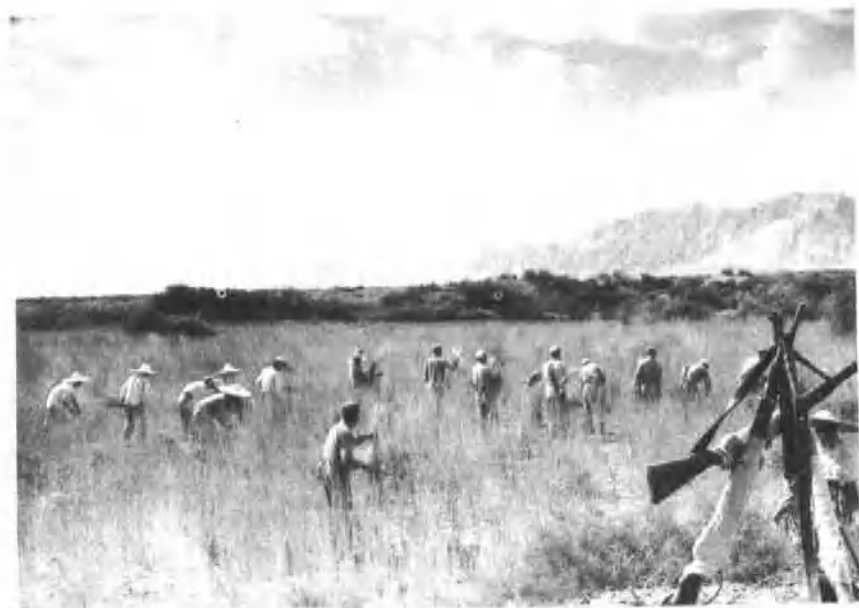
1950年二军十二团在巴楚七里塔克荒地种出了大量油菜