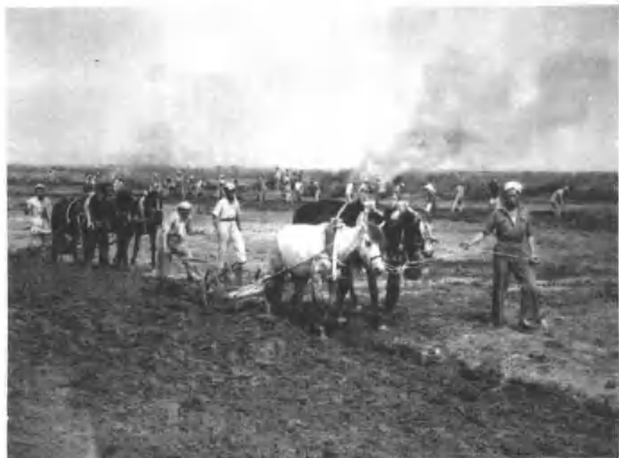
1950年,四师十团在疏勒县罕那里克开荒种地