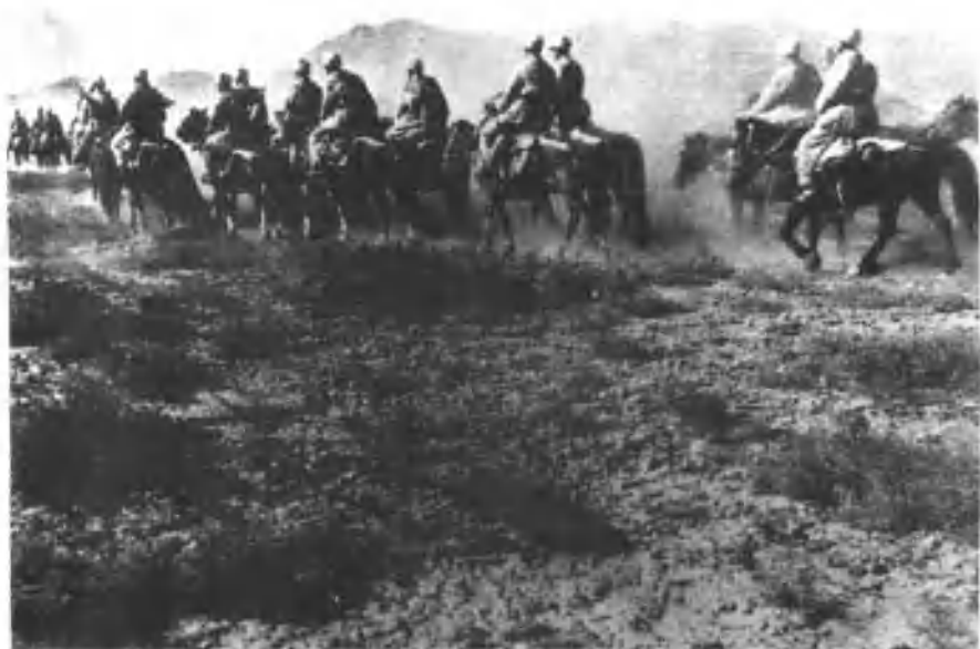
1951年六军十七师四十九团横穿500里将军戈壁围追残匪