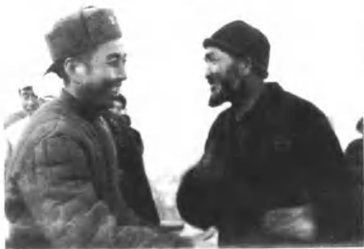
1949年冬， 王震将军在喀什 与维吾尔族农民 亲切交谈