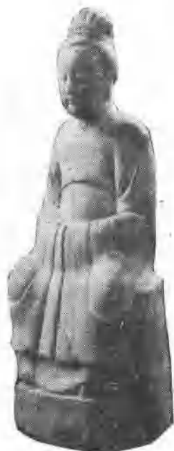
南宋木雕：“夫人”神像

南宋绍兴二十五年(1155)，莆田发生瘟疫，传说城郊白湖(今阔口村)有人梦见妈祖告诉他离海湾边一丈许的地下有甘泉，喝了可以痊愈疫病。第二天按照妈祖指梦的地方挖下，果然一股清泉沸涌，其味甘醇。事迹传开后，汲饮的人络绎不绝，疫情也得到了控制，这口井就被群众称为“圣泉”。兴化军知军把此事上奏朝廷，高宗皇帝诏封神为崇福夫人。从此以后，南宋历朝皇帝根据地方官上奏妈祖“护国庇民”的神迹，先后加封十二次，封号亦由“夫人”进而为“圣妃”。