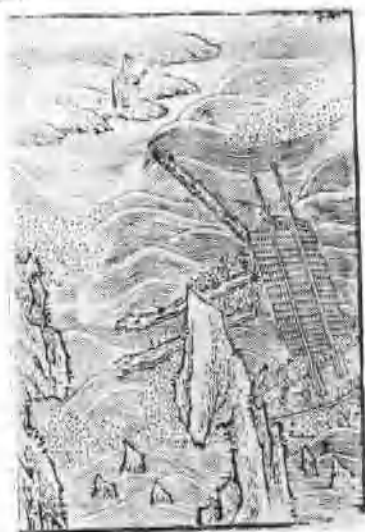
清代木刻：林默救商图

生长在大海之滨的林默，还洞晓天文气象，熟习水性。湄洲岛与大陆之间的海峡有不少礁石，在这海域里遇难的渔舟、商船，常得到林默的救助，因而人们传说她能“乘席渡海”。她还会预测天气变化，事前告知船户可否出航，所以又传说她能“预知休咎事”，称她为“神女”、“龙女”。