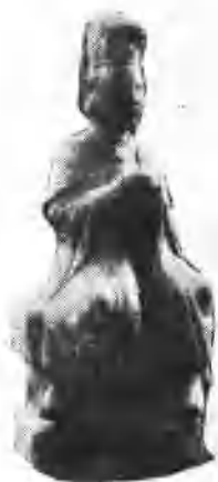
南宋木雕：“圣妃”神像

宋王朝为了增加国库收入，大力奖励发展海外交通贸易。我国东南沿海港口城市如广州、泉州、温州、杭州、宁波、上海等，在两宋时先后设立了市舶司，负责管理海上贸易和课征进出口税，而航海的人也就把妈祖的香火最先传播到这些地方。所以，南宋学者陈宓（莆田人）说：“今仰白湖香火，几半天下。”宋宁宗赵扩说：“灵惠妃宅于白湖，福此闽粤。”历史上确曾有这种现象。广州是我国最早对外开放的港口，而在南宋初就创