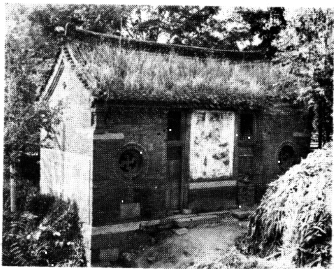
肥城县过村古戏楼，重修戏楼碑志 大清道光拾年岁次 庚寅 菊月穀旦