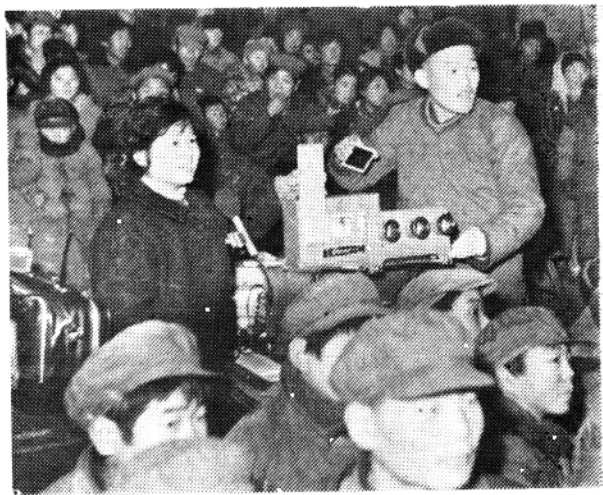
肥城县电影队在做电影幻灯宣传。