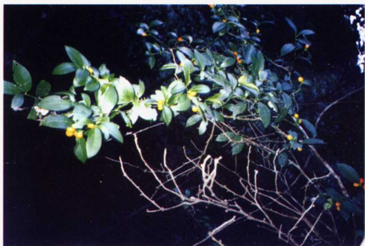
(11) 金豆 濒危EN