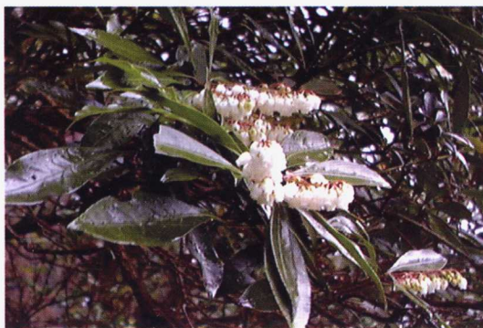
(12) 马醉木 易危VU