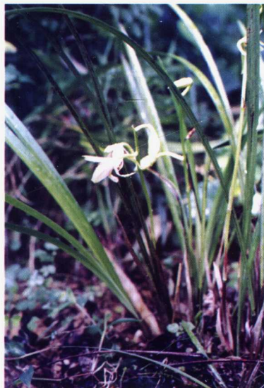
(14) 春兰 易危VU