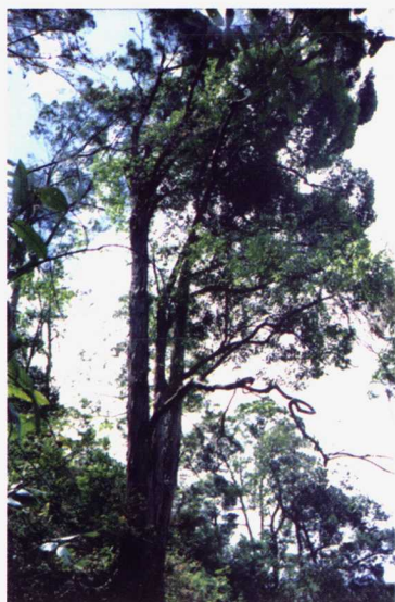
(13) 吊皮锥 易危VU