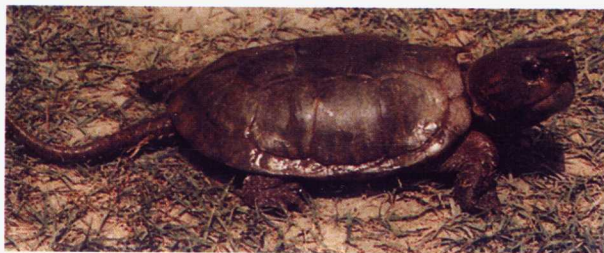
(7) 平胸龟 濒危 EN