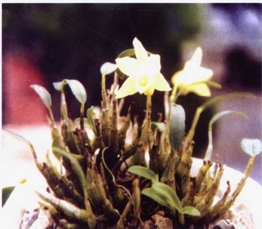
(15) 广东石斛 濒危EN