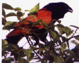
小鸚鵡 近危 几近符合易危