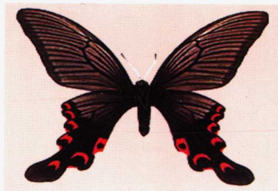
(6) 宽尾凤蝶 易危 VU