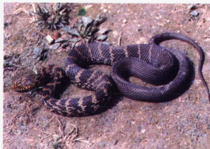
(8) 王锦蛇 易危 VU