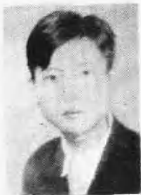
俞清志烈士 (1917—1942. 1)