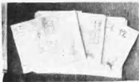
《浅作》(1945. 11—1947. 3)