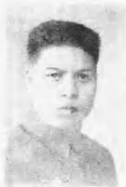
钱康民烈士 (1905—1939. 8)