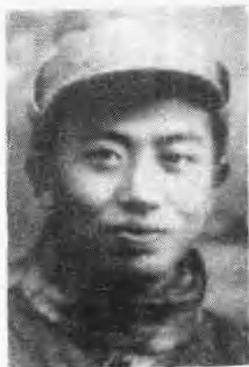
沈波烈士 (1925—1947. 3)