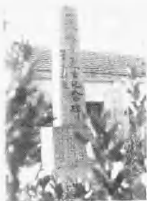
夏再生烈士纪念碑