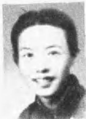
姚魁元烈士 (1921—1944. 3)