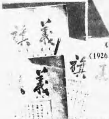
《义旗》(1940. 6—1940. 11)