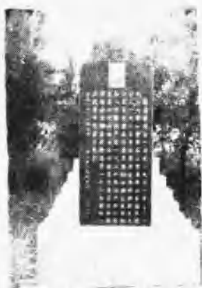
张应春烈士纪念碑铭