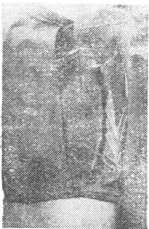
这是余建亭同志在嫩江军区部队 作战时和在富裕县土改中使用的 行军袋