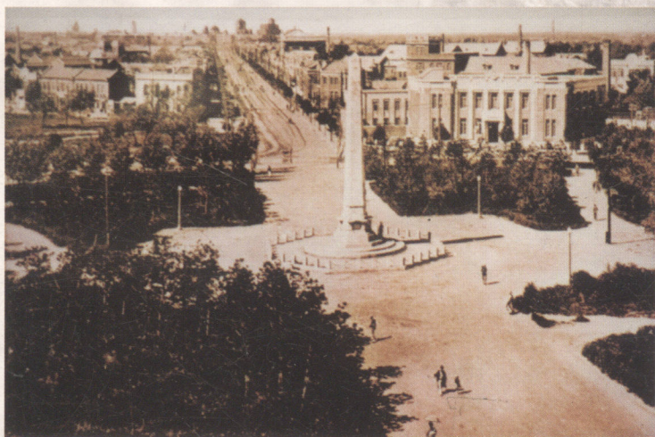
二十年代中期的中央大广场