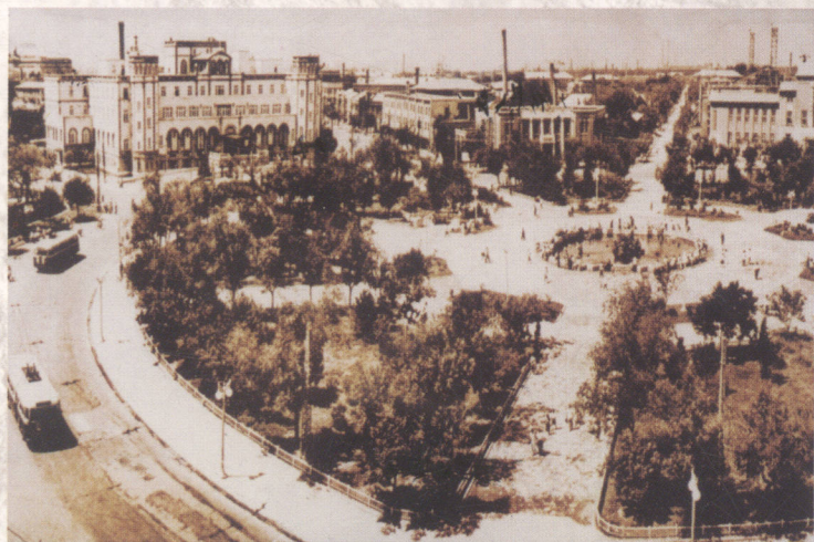
新中国成立初期的中山广场