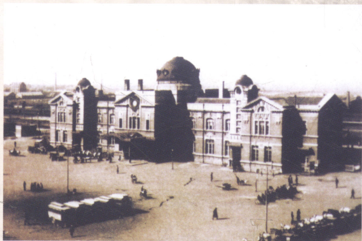
三十年代初期沈阳站前广场