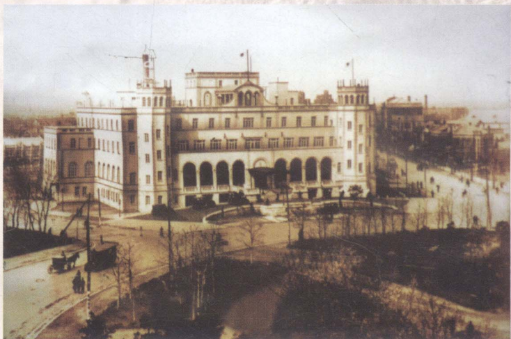
大和旅馆(现辽宁宾馆)