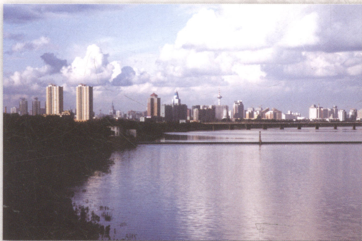
浑河和平段沈水湾公园晨色