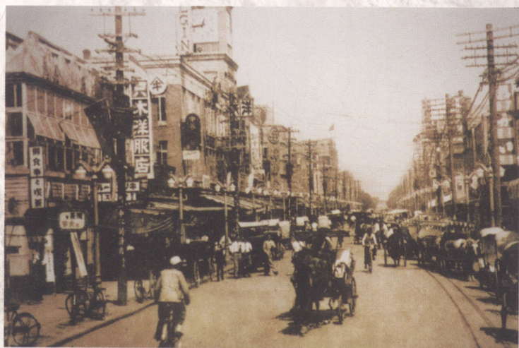
三十年代太原街中部