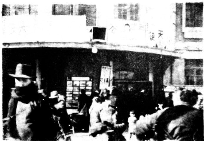
1920年兴建的世界馆，是大连第一座以中国观众为对象的影院，图为当时留京明之供画。