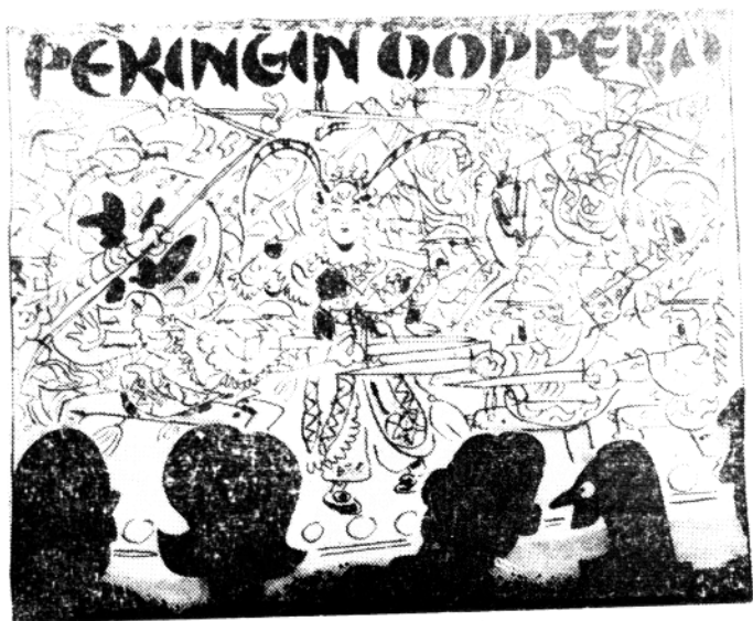
1982年，大连艺校实验京剧团出访北欧四国时，外国报纸介绍该剧演出为曼画 明之供稿