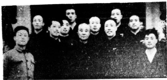
1957年初，旅大京剧团演员周少楼（前排右2）等在沈阳演出时，与著名表演艺术家盖叫天（前排中）合影留念 明之供稿