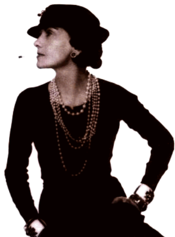
Coco Chanel 女士