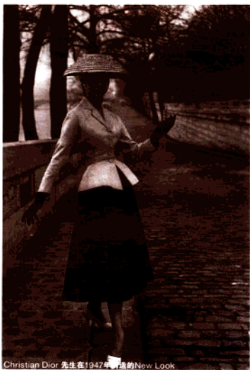
Christian Dior先生在1947年推出的New Look