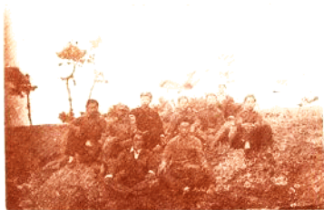
大众日报印报厂机印股部分同志合影（1947年秋在前长城岭村）