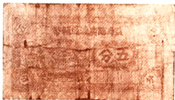
北海銀行鈔票（冀魯邊、清河區）和益壽臨廣流通輔幣