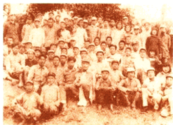
《滨海农村》报铅印厂全体人员合影 (1947年7月于日照县北头村)