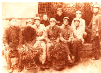
《滨海农村》报社负责同志合影 (1947年7月于日照县沟滩)