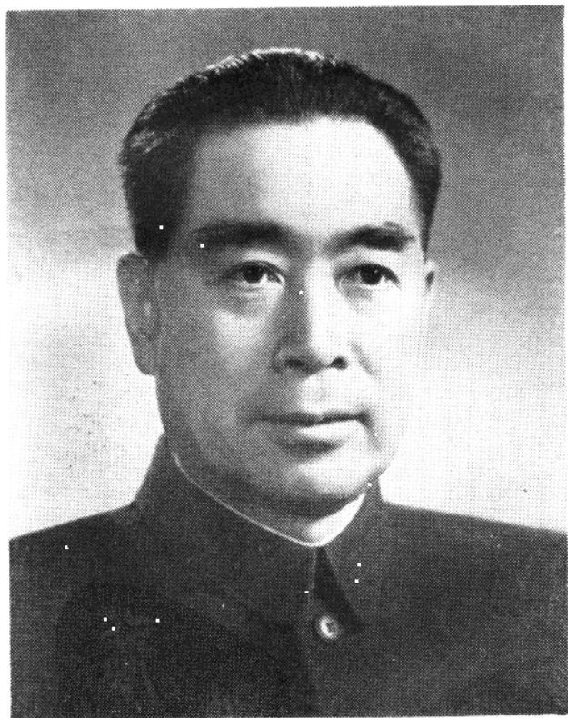
中国人民伟大的无产阶级革命家 杰出的共产主义战士周恩来同志