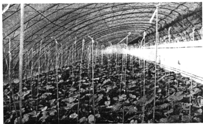
新建的温室大棚蔬菜