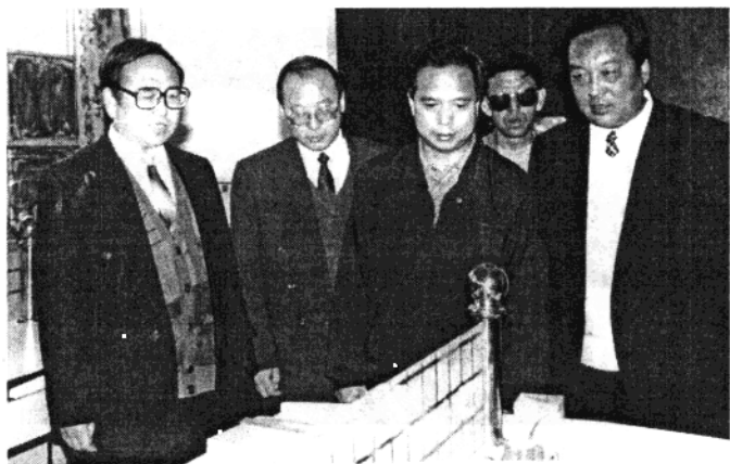
陕西省省委书记李建国(左三)在时任横山县委书记刘买义(右一)、县长孔德勤(左二)和职教中心校长苗飞(左一)的陪同下视察横山职教中心