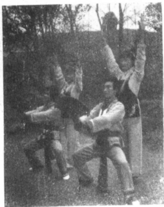
秀山花灯歌舞剧团演出《双采茶》