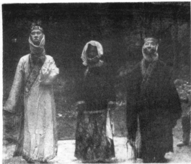
酉阳铜西掃卫阳戏班演出《忠孝记》前演员合影