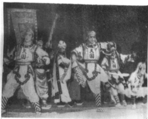
垫江县川剧团演出新编历史故事剧 《翼王旗下四姑娘》剧照之一