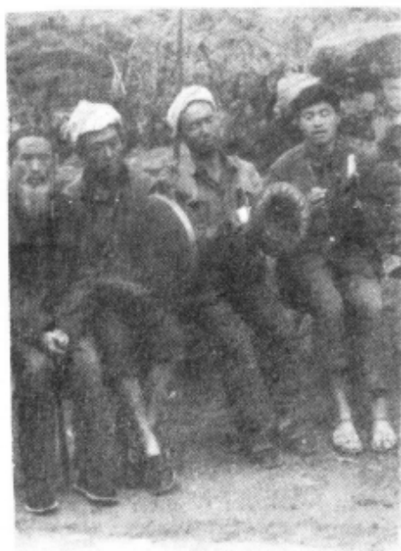
合谐的阳戏小乐队