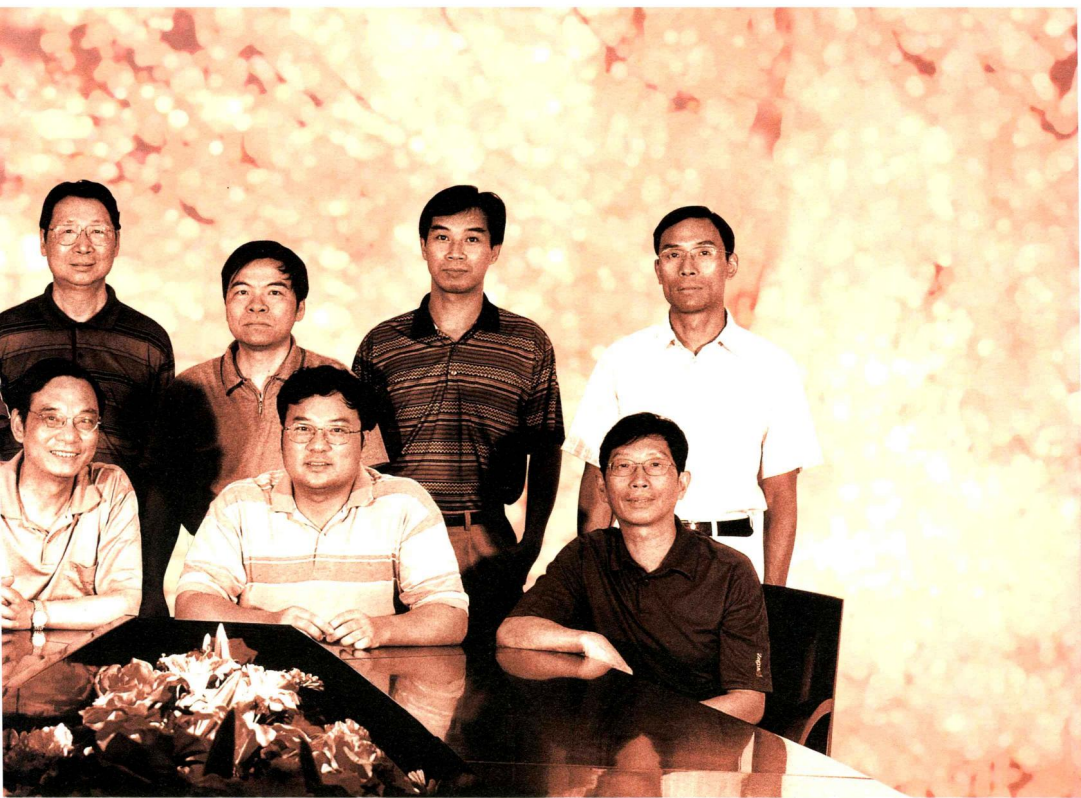
佛山传媒集团领导 List of Leaders of Foshan Media Group, Inc.