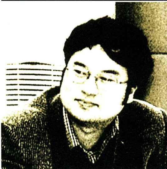
佛山传媒集团党委书记、社长（总裁）