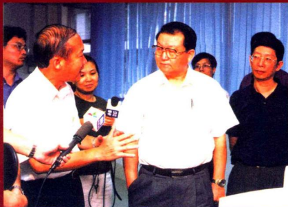
■ 中共中央政治局常委 李长春 到佛山电视台视察工作。

Li Changchun, Member, Standing Committee of the Political Bureau of the CPC visited Radio Foshan.