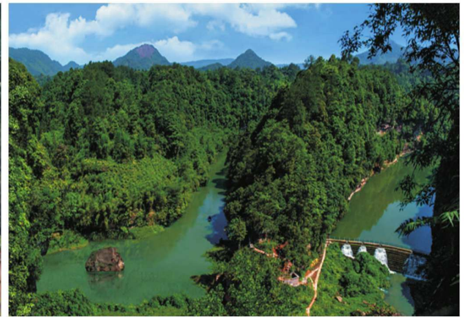
菽坝乡穿牛鼻风景。