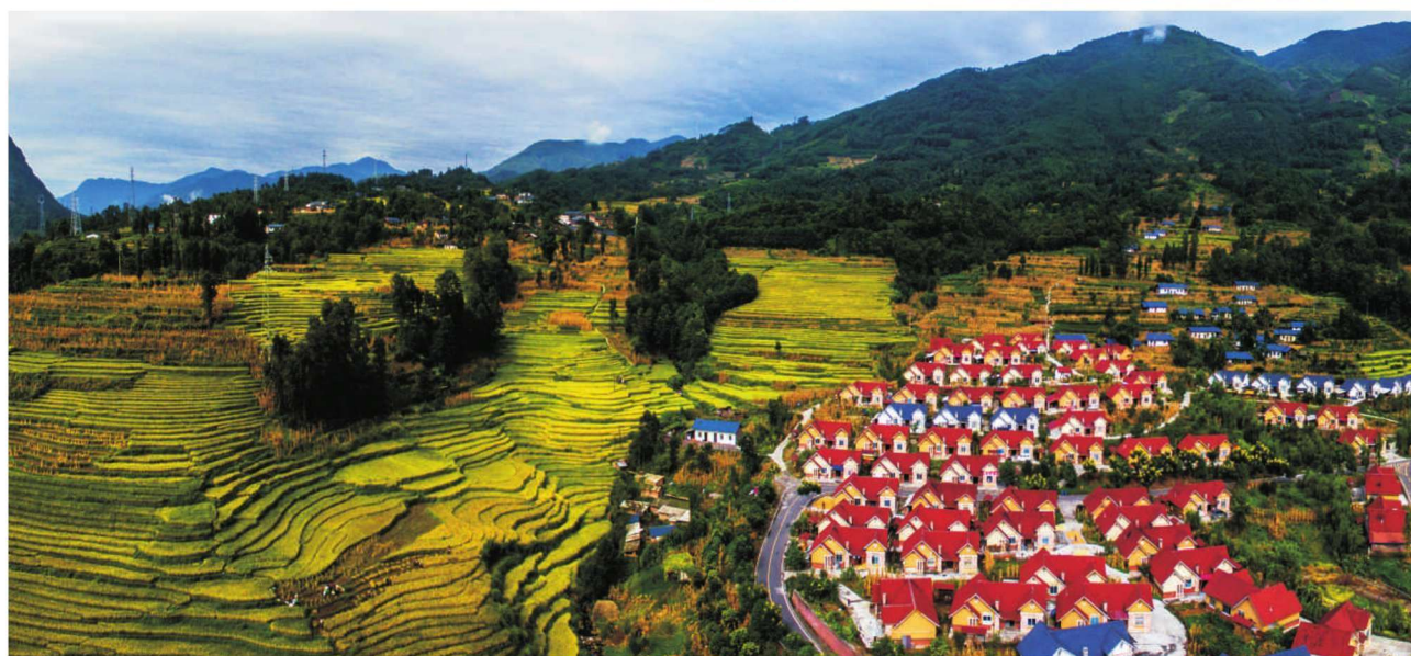
烟峰彝家新寨田园风光。