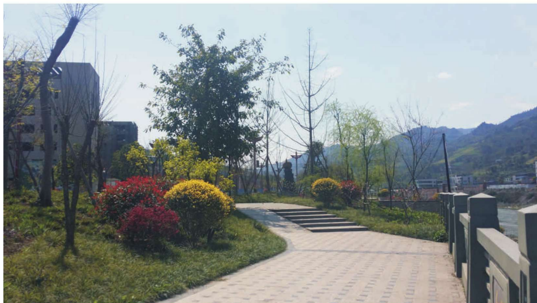
红旗滨河景观公园。