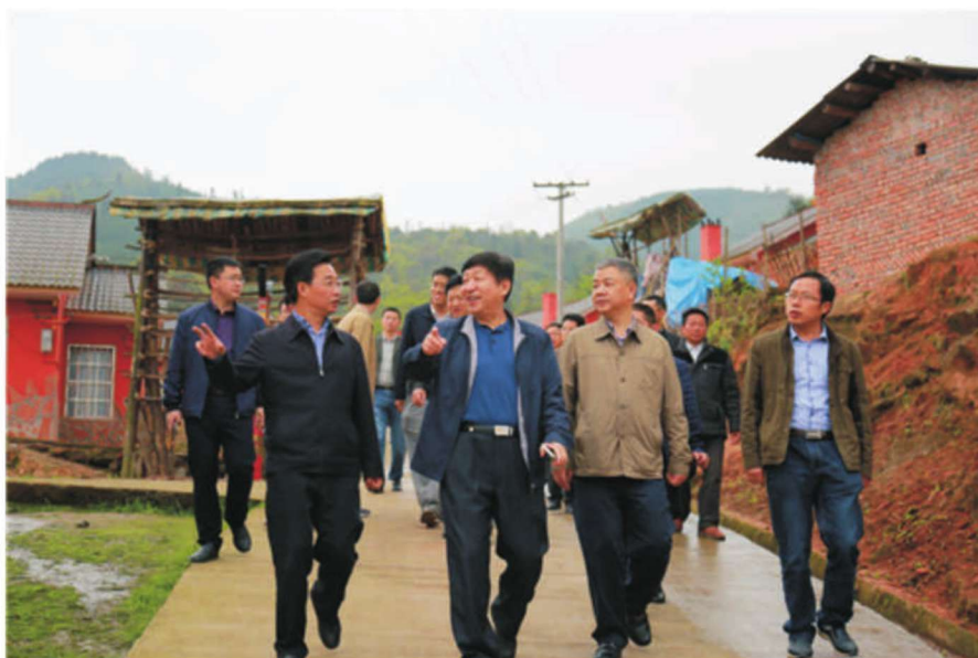
2016年4月20日，省委常委、组织部部长范锐平（左三）一行，在马边烟峰镇调研“两学一做”学习教育工作情况。