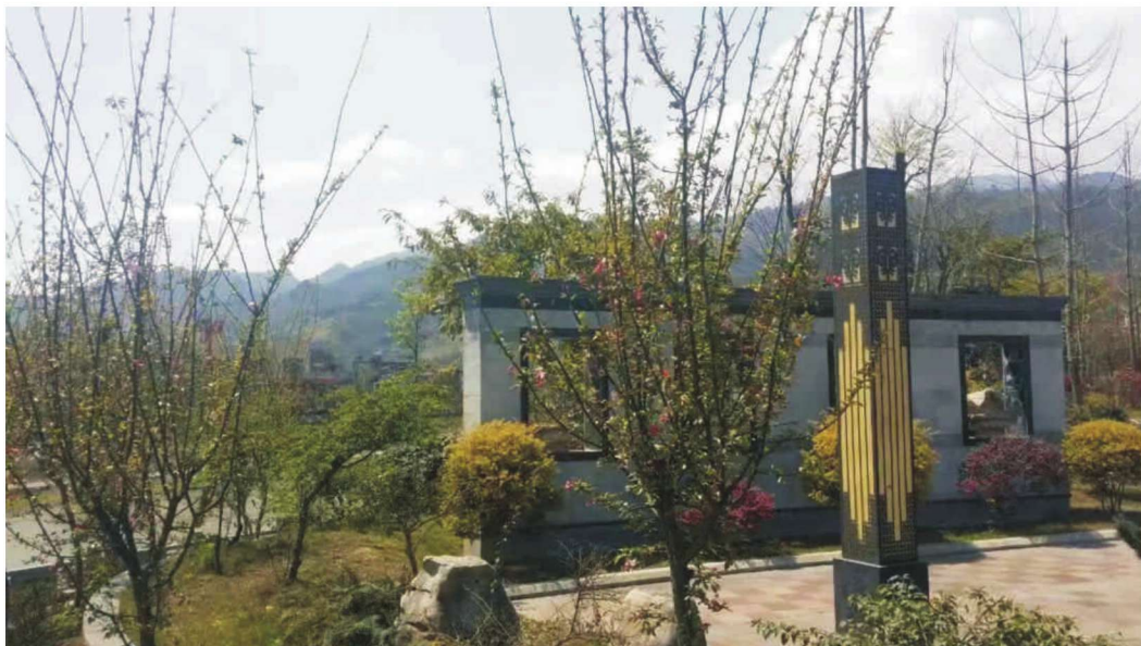
光明滨河景观公园。