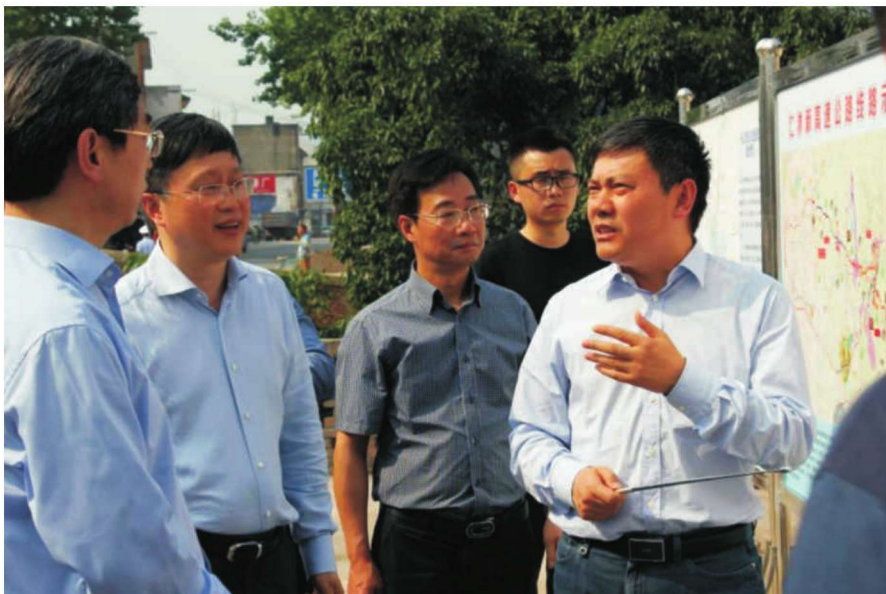
2016年5月4日，交通部副部长戴东昌（右）在马边劳动乡调研交通精准扶贫工作。