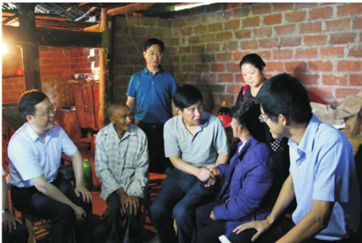
2016年7月16日，中央纪委秘书长杨晓超（中）率中央纪委调研组在马边民建镇入户看望慰问困难群众。