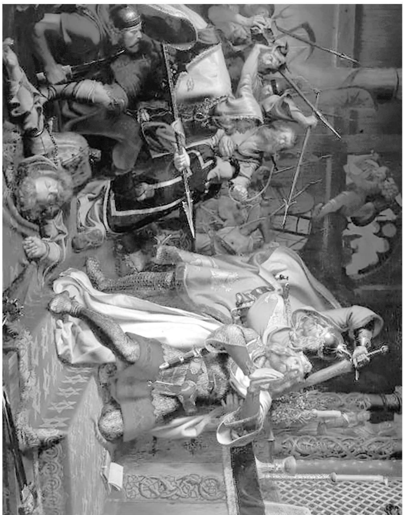
丹麦国王克努特四世在欧登堡的圣阿班教堂不幸遇刺