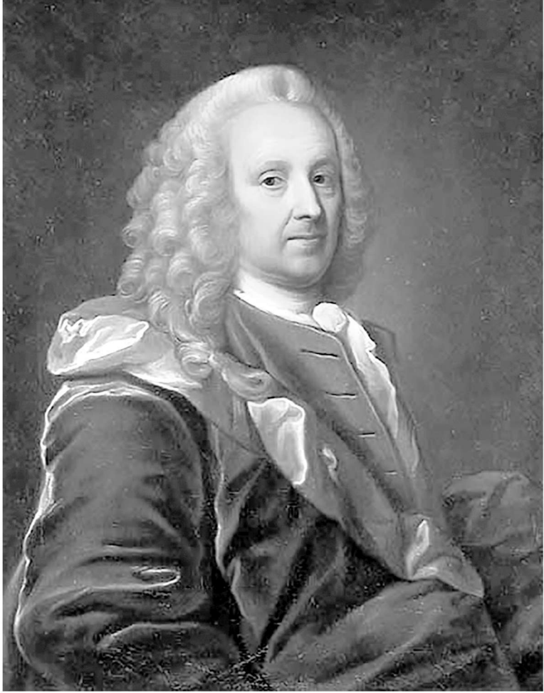
路德维希·霍尔伯格