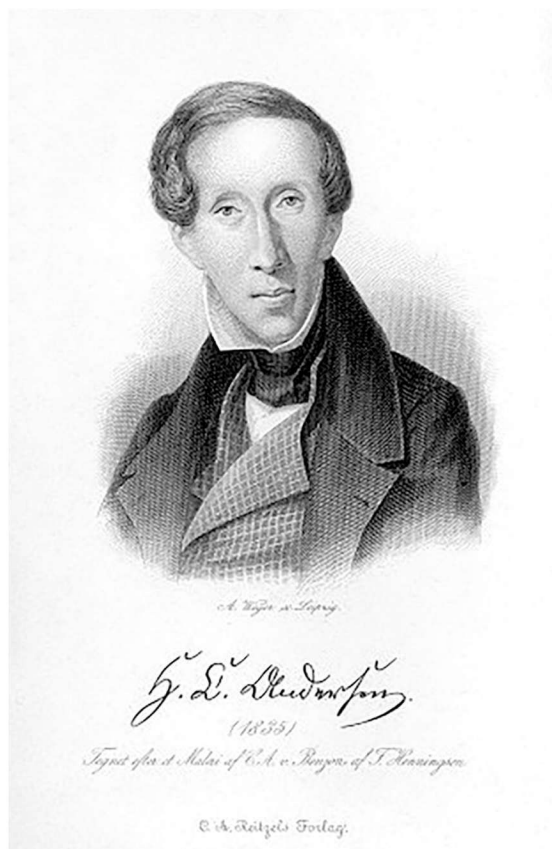
1835 年的汉斯·克里斯蒂安·安徒生