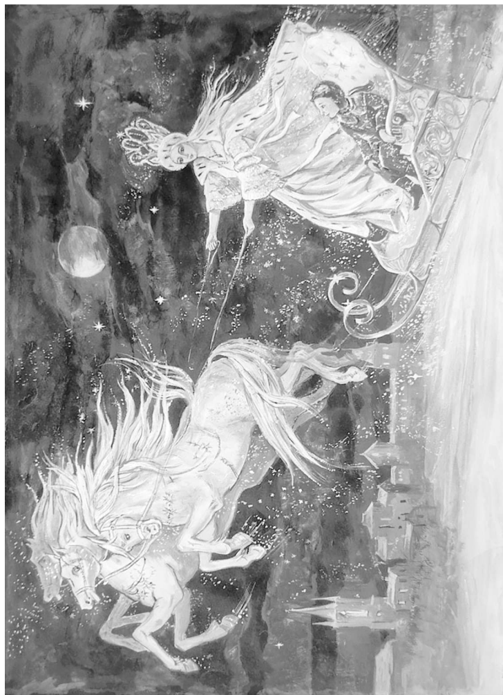
《冰雪皇后》中的插图