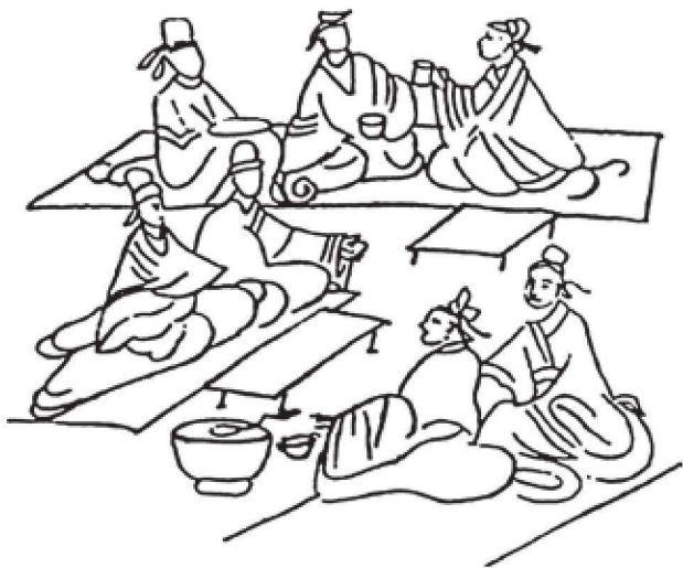
图 1-3 汉墓画像砖《宴饮图》

中国古代社会在进入秦汉后，出现了另一个繁盛的时期，由于国家的统一、文化的融合，人们的起居也随之有了一定的变化。此时，漆木家具进入了全盛时期，不仅数量大、种类多，而且装饰工艺也有较大的发展。家具的改变在汉代尤为明显，汉代出现了“坐榻”，与席地而坐形成了汉代主要“坐”的方式（图 1-3），为中国古代家具史开辟了新的篇章。