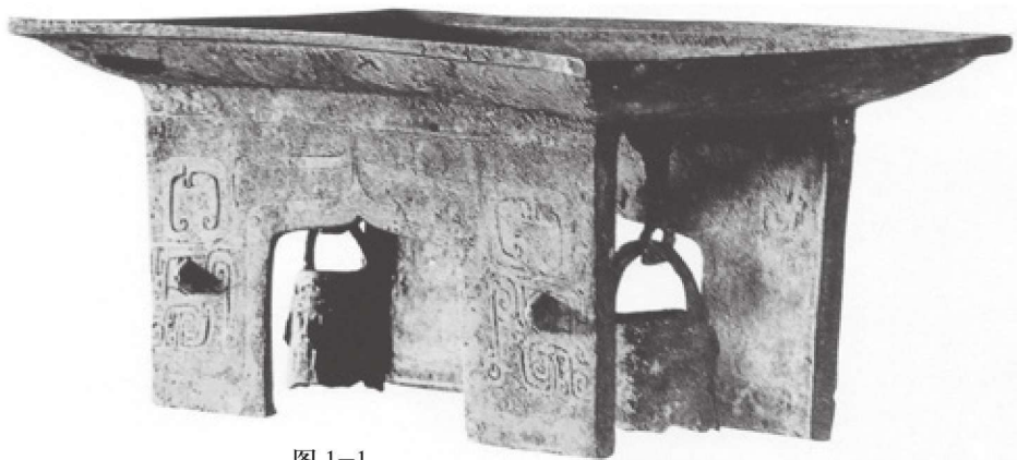
图 1-1 辽宁义县出土商代青铜板式俎

殷商西周是青铜器高度发达的时期，这一时期的家具主要是通过青铜器的形式展现在我们眼前。俎、禁是这一时期代表性的家具，其中饕餮蝉纹铜俎造型别致，纹饰精美，具有极高的艺术价值。1979 年河南出土的春秋晚期的青铜禁透雕蟠螭纹，工艺卓越。这些青铜器反映出这一时期青铜家具在铸造技术、实用、装饰方面都已达到较高的水平（图 1-1）。