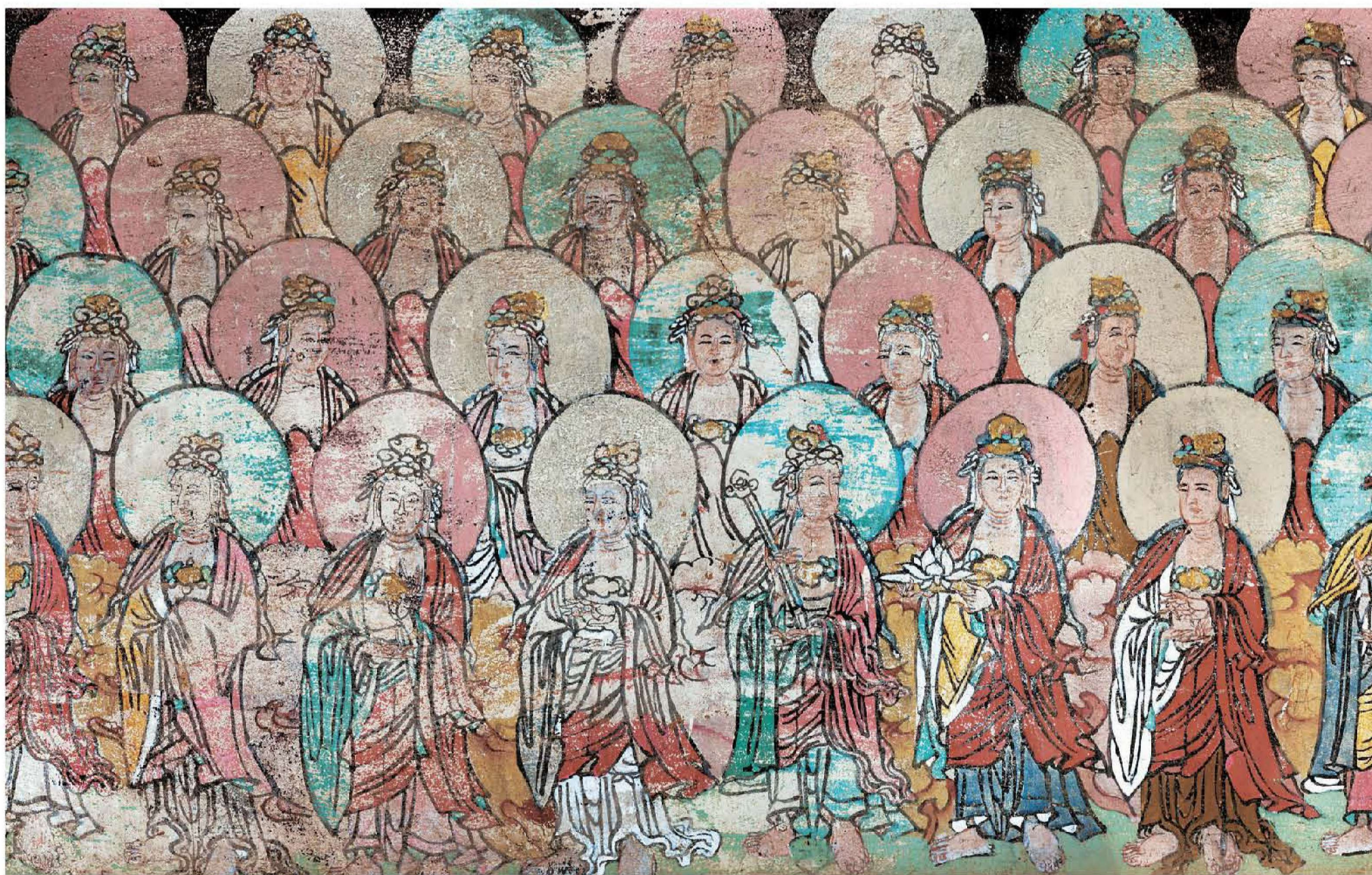
图7、图8 | 诸菩萨众