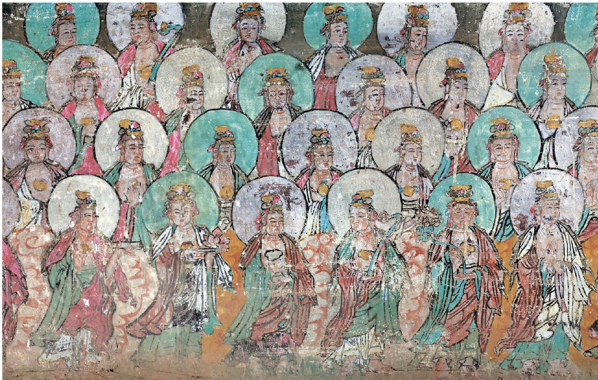
图5、图6 | 诸菩萨众