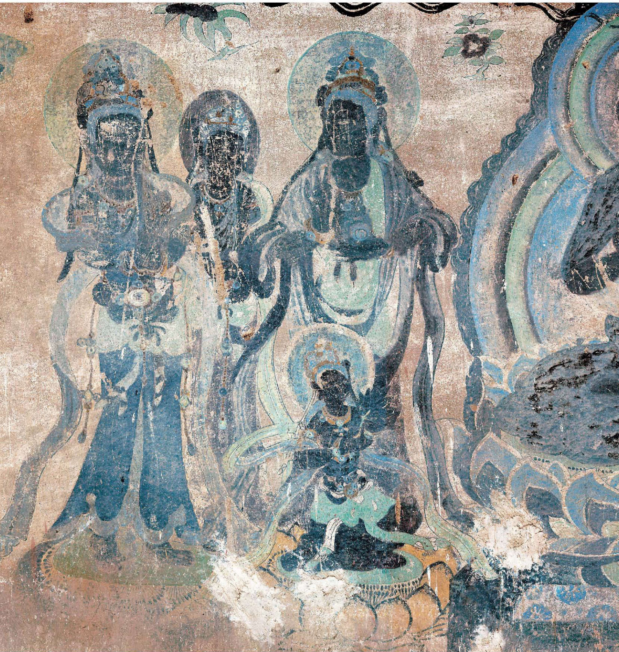
图4 | 弥陀说法图

图分三组，中间一组绘释迦说法，释迦居中，观音、大势至等七菩萨胁侍两端；两侧绘文殊、普贤菩萨。壁之两端有僧俗供养人像，一列是披袈裟的僧徒，一列是袍服大冠的文官，内有一人，权衡短促，嘴两旁出胡须，与敦煌壁画中所见为同一格式。颜色除石绿外，皆呈深暗的铁青色。各像衣纹姿态极流畅，画脸和胡须的笔法，含有汉画遗风。