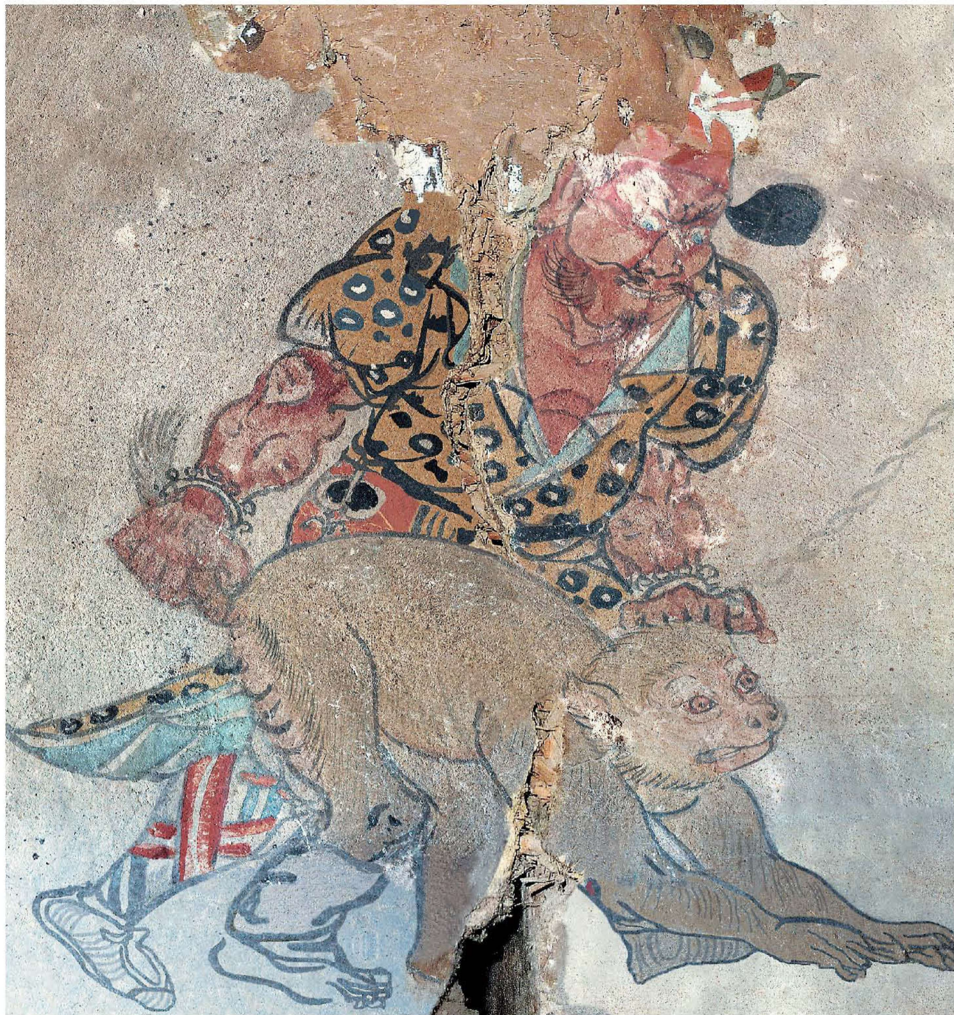
图1 | 天王降妖图

描绘一天兵天将正在捉拿妖魔。绘一神将身着豹皮服，腰带紧束，脚穿草鞋，正在躬身降服猴妖，猴妖的颈部还系着铁链。