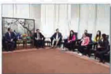
学院领导看望免试推荐攻读澳门科技大学硕士学位研究生