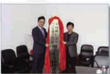
学院成为泰国博仁大学中国—东盟国际学院留学生考核培养基地