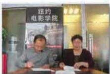
学院与纽约电影学院签署合作协议