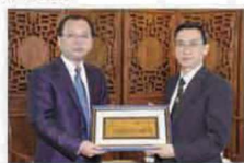
学院与澳门科技大学签署合作协议

学院力求与国际先进的人才培养模式接轨，积极拓展国际学术合作渠道，现已与台湾铭传大学、台湾朝阳科技大学、台湾树德科技大学、台湾圣约翰科技大学、澳门科技大学、澳门城市大学、英国普兹茅斯大学、英国北安普顿大学、美国纽约电影学院、美国加州大学河滨分校、韩国又松大学、澳大利亚堪培拉大学、日本亚洲现代经济研究所、马来西亚世纪大学、泰国博仁大学、泰国商会大学、美国劳瑞德教育集团、美之旅国际教育交流中心、埃及亚历山大大学、埃及巴德尔大学、宁夏大学等国内外院校实现访学、学术交流、推免研究生、师资培养、带薪实习等合作项目。