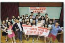
学院学生在台湾参加国际礼仪与形象塑造赛