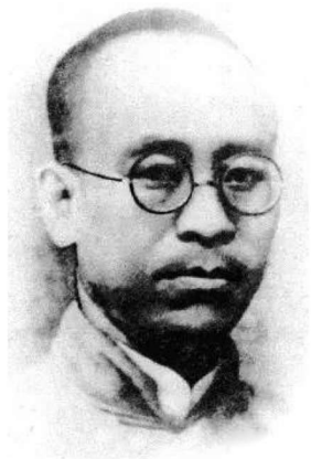
周南创始人 著名革命教育家 朱剑凡