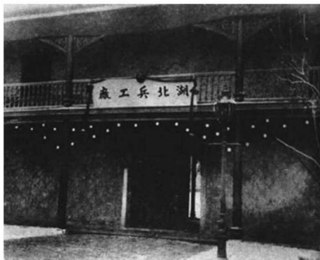
湖北兵工厂（湖北枪炮厂）

在国防观念和国防外交政策的变革方面：由于西方列强最早是从海上侵略中国的，因此在鸦片战争以后相当长的时期内，清政府一直都把国防的重点放在海岸，认为威胁主要来自英法等国的海上入侵，只有林则徐提出“终为中国患者，其俄罗斯乎”。历经俄罗斯在中国北部的趁火打劫、英国在中国西部的蠢蠢欲动、法国在中国南部的步步紧逼和中法战争的爆发，以及日本在中国东面的虎视眈眈，清政府陷入来自各方的国防危机。于是清政府改变过去的关塞之防为全面的国防，海陆并举。西方列强的大