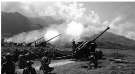
解放军“联合行动——2014E”实兵演习

经济是国防的基础，社会经济制度决定国防活动的性质，社会经济状况决定国防建设的水平。国防经济活动是指为了国防而进行的生产、分配、交换消费及其管理的经济实践活动，其目的是保持一定的军事实力和潜力，从而有效地保障国家安全。现代条件下，无论是国防建设还是国防斗争，都要广泛采用经济手段，这些手段主要有国防经济活动、经济动员、经济战、经济制裁等。