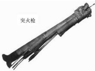
公元1259年，宋军发明的突火枪

中国古代的军事技术走在世界前列，早在公元8世纪的唐朝时期，就发明了火药并应用于军事，引起军事史上划时代变化。中国是世界上最早制成了“突火枪”；最早制成并在战斗中使用金属炸弹；最早在野战、攻城、守城、要塞、海防、战舰上使用；最早制成各种多发和多级“火箭”，出现了世界上“第一个企图使用火箭作运输工具的人”。同时中国古代注重发展养马业。马是中国古代国防力量的重要因素。发展养马业，既有利于提高部队的战斗力、运输力，又有利于带动民间养马，促进经济发展。