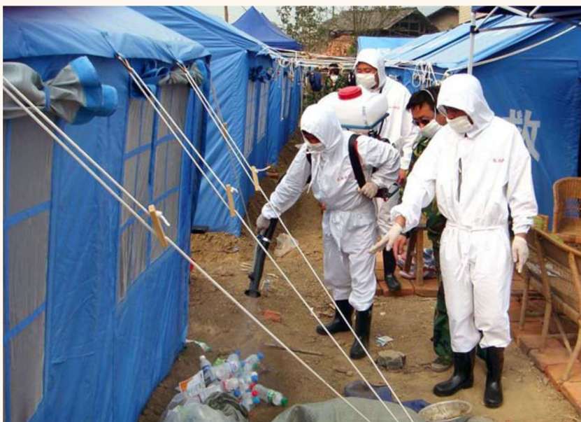
山西长治防疫 队正在对集中安置 区进行防疫消毒