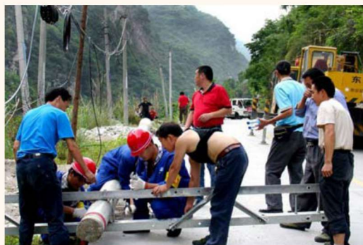
电力公司紧急抢修供电设施保障早日用电