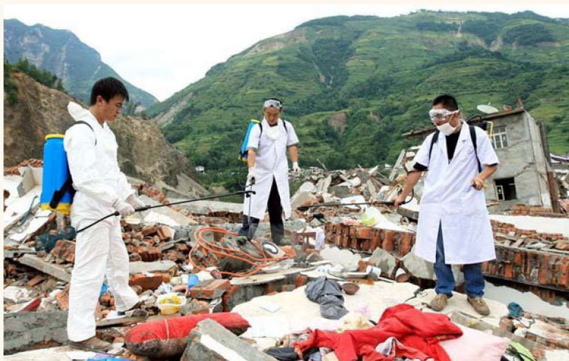
对灾区全面实施防疫消毒，始终 将发生疫情的可能 控制在“0”