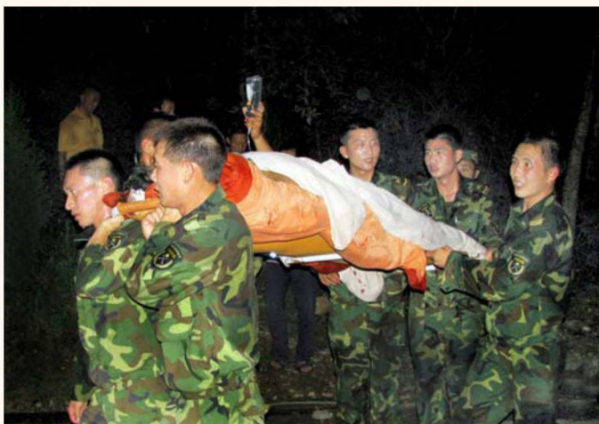
解放军官兵奋力 抢运伤员