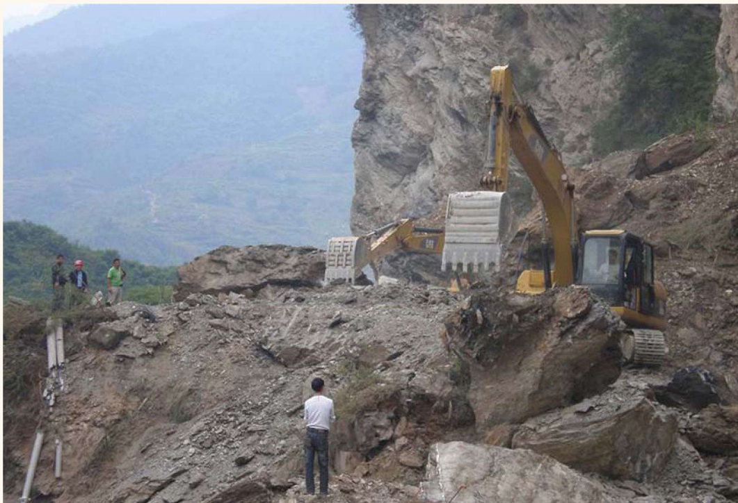
地震发生后，县交通部门紧急出动挖掘机数十台，夜以继日的清理道路上的塌方，迅速打通救援道路