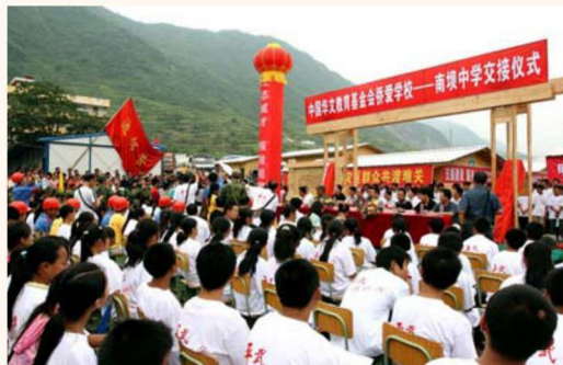
2008年7月13日，由华侨华人捐建的南坝中学板房学校正式开学