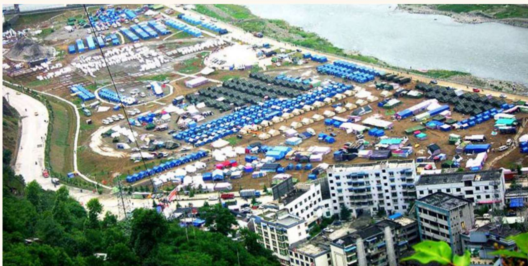
地震发生后，县委、县政府迅速组织搭建简易防震棚，及时发放帐篷，基本解决了医疗救治和受灾群众的应急居住要求