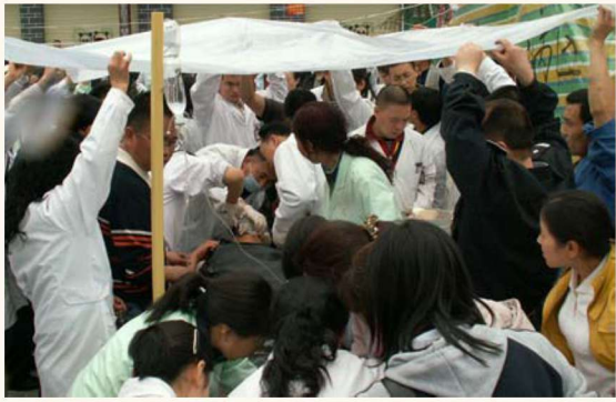
齐心协力抢救伤员