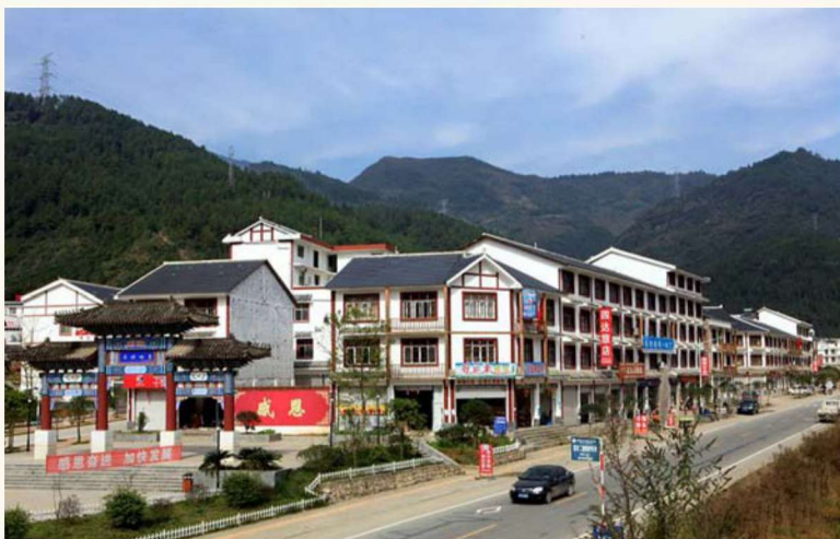
响岩新场镇一条街