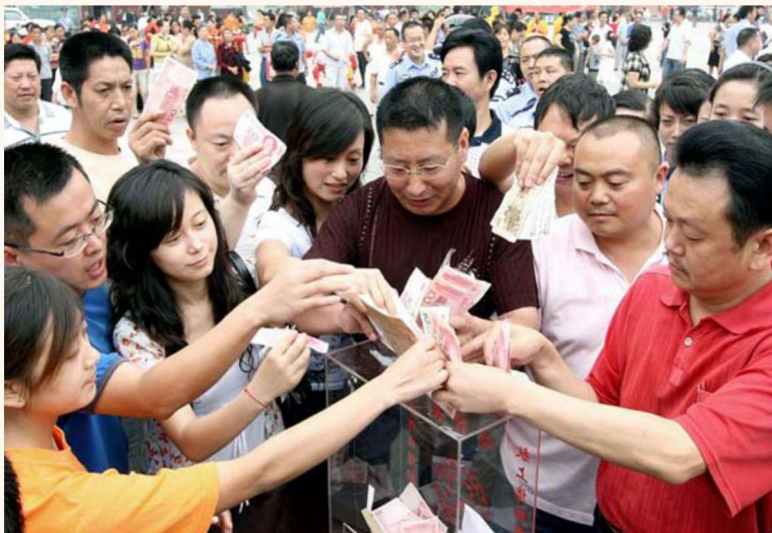
平武各族人民 踊跃捐款