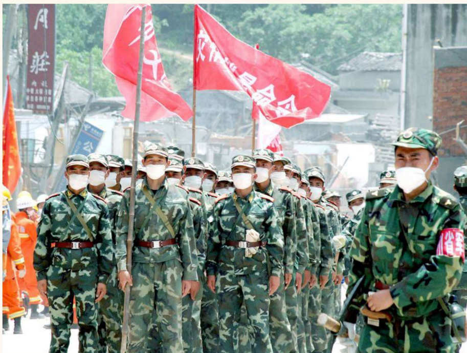
救援部队进入灾区平通立即投入战斗