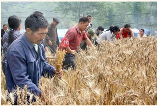
在抗震救灾中，全县基层党组织组建各类“党员抢险队”“党员突击队”“党员服务队”，成为震不跨的堡垒、压不弯的脊梁。图为南坝镇“党员突击队”正帮助受灾群众收割小麦