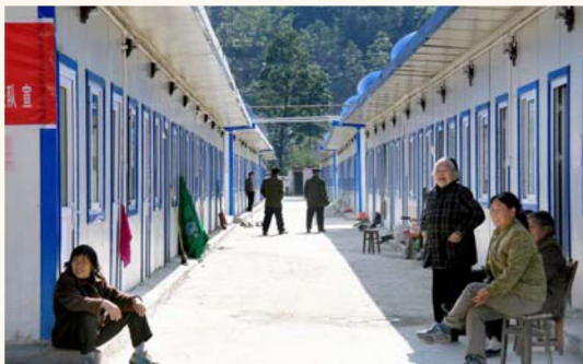
住进板房的受灾群众充满生活信心