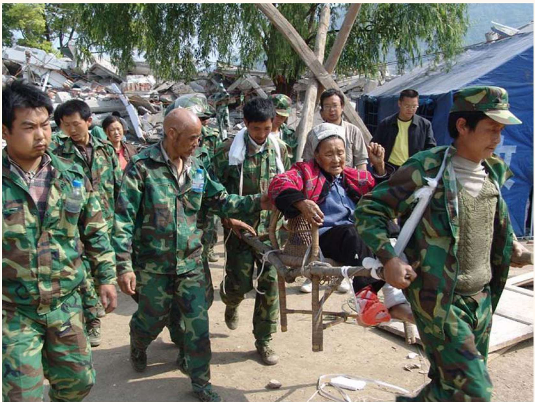
县民兵预备役应急队在灾区转运受伤群众