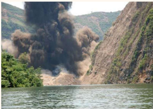
6月23日14时，马鞍石堰塞湖成功爆破泄洪，由于泄洪前切实做好了泄洪避险工作，确保了下游1.5万余名群众安全撤离转移，使整个泄洪过程无一人伤亡