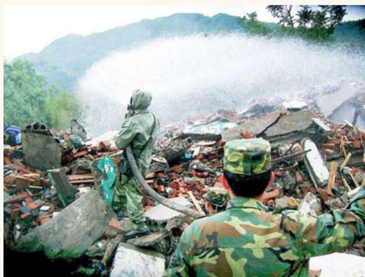
防化团官兵冒着酷暑在废墟上进行全面消毒处理