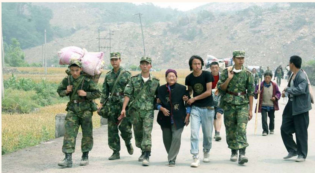
救援部队冒着生命危险挺进水观，将大批受灾群众转移到南坝安置点