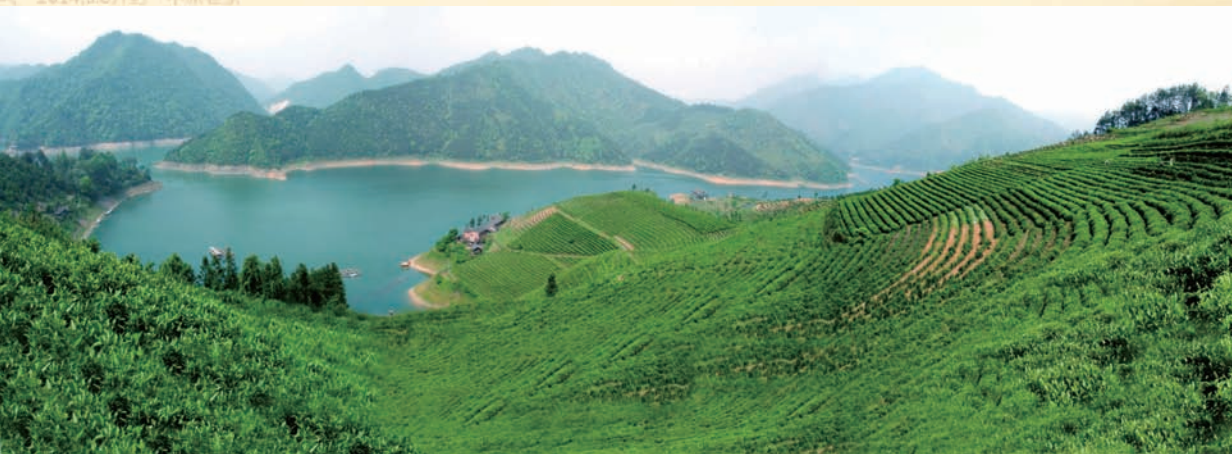
湖南安化凤凰岛是中国安化黑茶原料核心产地

茶及其衍生的茶文化均出于中国，发乎神农，闻于鲁周公，兴于唐而盛于宋，千年薪火相传。