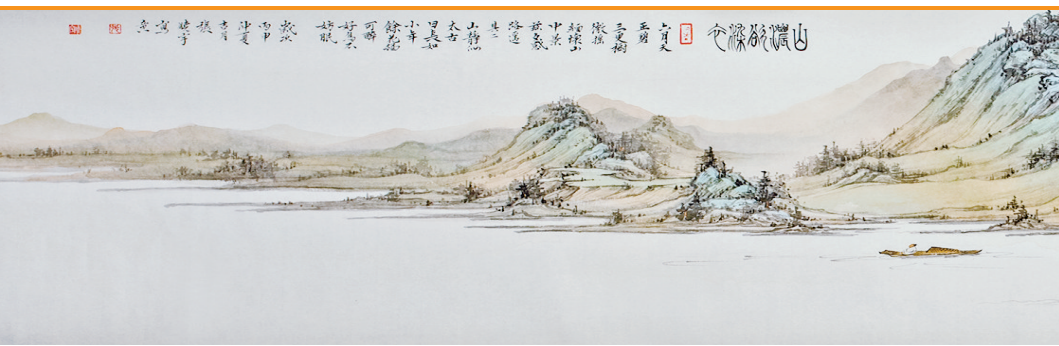
《山澜欲染云》 张晓宇