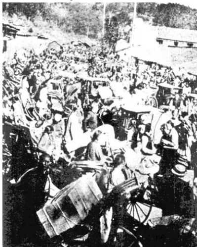
清军在南京城内搜捕革命党人，这是南京居民纷纷外逃的混乱场面。

1911年辛亥革命前夕，张勋调任江南提督，节制江防各军，并会办长江防守事宜，驻防浦口。同年10月10日武昌起义爆发，张勋请求带兵西进，援救武昌清军，但因当时南京形势亦不稳，新军徐绍桢、樊增祥正在酝酿起事，故两江总督令张勋率部至南京。11月7日，张勋部在雨花台与新军开战。