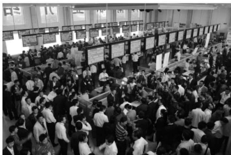
火热的人才招聘会

改革开放后，在从计划经济体制向市场经济体制转型的过程中，我国的就业制度发生了根本性变化，彻底改变了统包统配的就业制度，逐步过渡到适应市场经济体制要求的市场导向型就业制度。中共十六届三中全会通过的《中共中央关于完善社会主义市场经济体制若干问题的决定》提出，要坚持劳动者自主择业、市场调节就业和政府促进就业的方针。这就为建立新型劳动就业体制指明了方向。这种就业制度有两个明显特征：