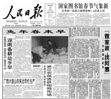
《人民日报》1999年2月19日头版 报道阿惠事迹

20世纪90年代，在国企工作的阿惠下岗后，曾开过小杂货店，后因家庭接连遭遇变故，生活困顿。抱着试试看的心态，阿惠走上了做家政这条路。刚开始做家政，阿惠经过了艰难的思想转变和辛苦的学习和磨炼，她积极学习居室保洁、烹调技术、服务心理学知识，细心观察客户的生活习惯、饮食口味、兴趣爱好。工作熟悉后，阿惠因为手脚勤快、客户满意度高，得到了人们的信任和尊重，也很快成为当地推荐的“下岗再就业典型”。