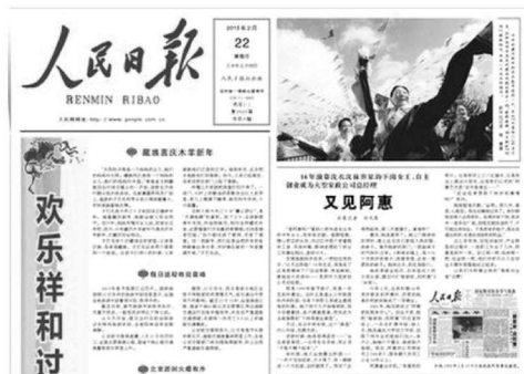
《人民日报》2015年2月22日 再次报道阿惠事迹

当地妇联组织了一个“巾帼家政服务队”，特地请阿惠做队长。做了队长的阿惠除了搞好队内管理，又开始为队员们奔波，联系客户，调解各种纠纷。在阿惠的带动下，更多下岗姐妹走上了家政服务工作的岗位。这一奔，使阿惠发现了家政服务这个大市场。